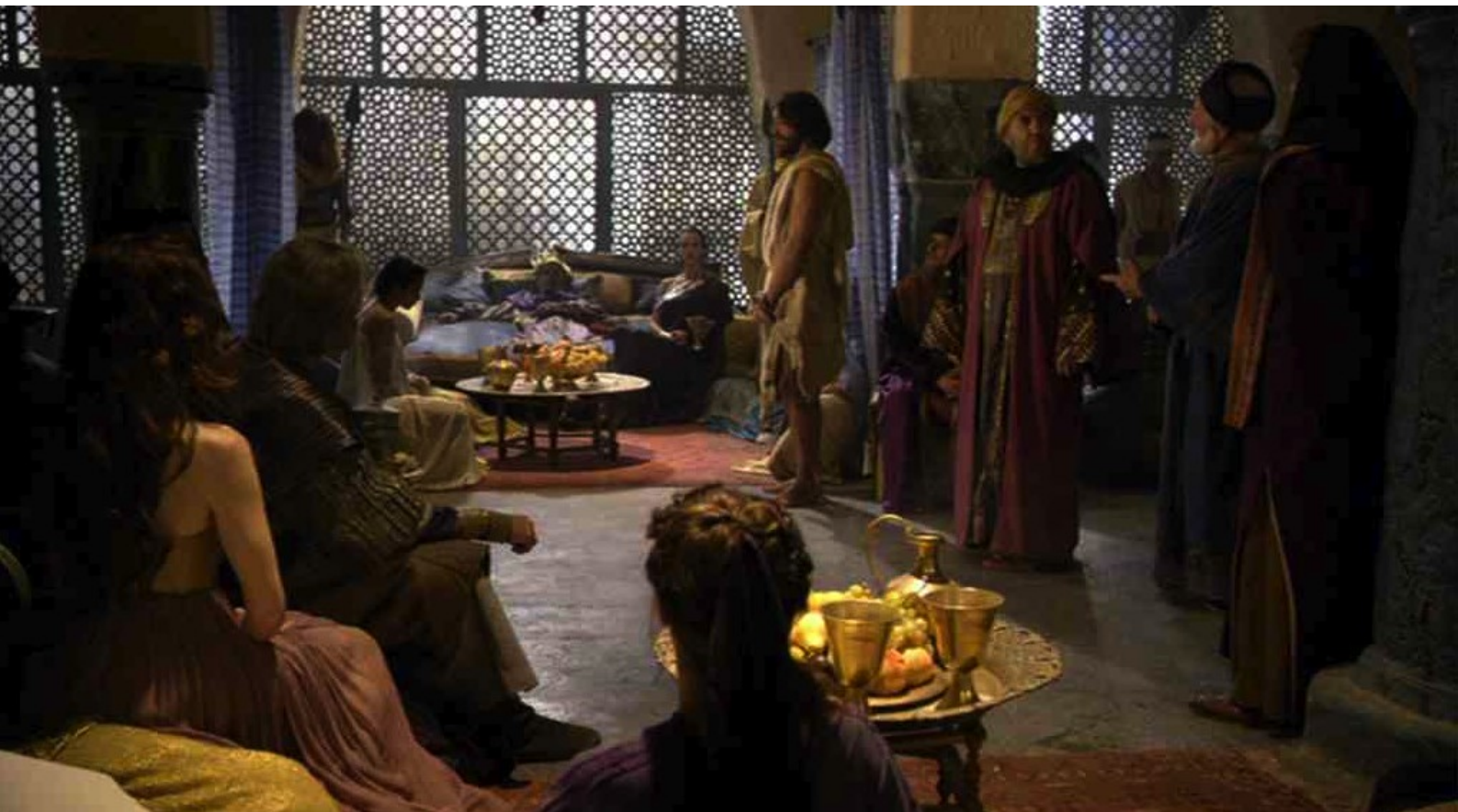
Maria di Nazaret : et le convier à la cour.