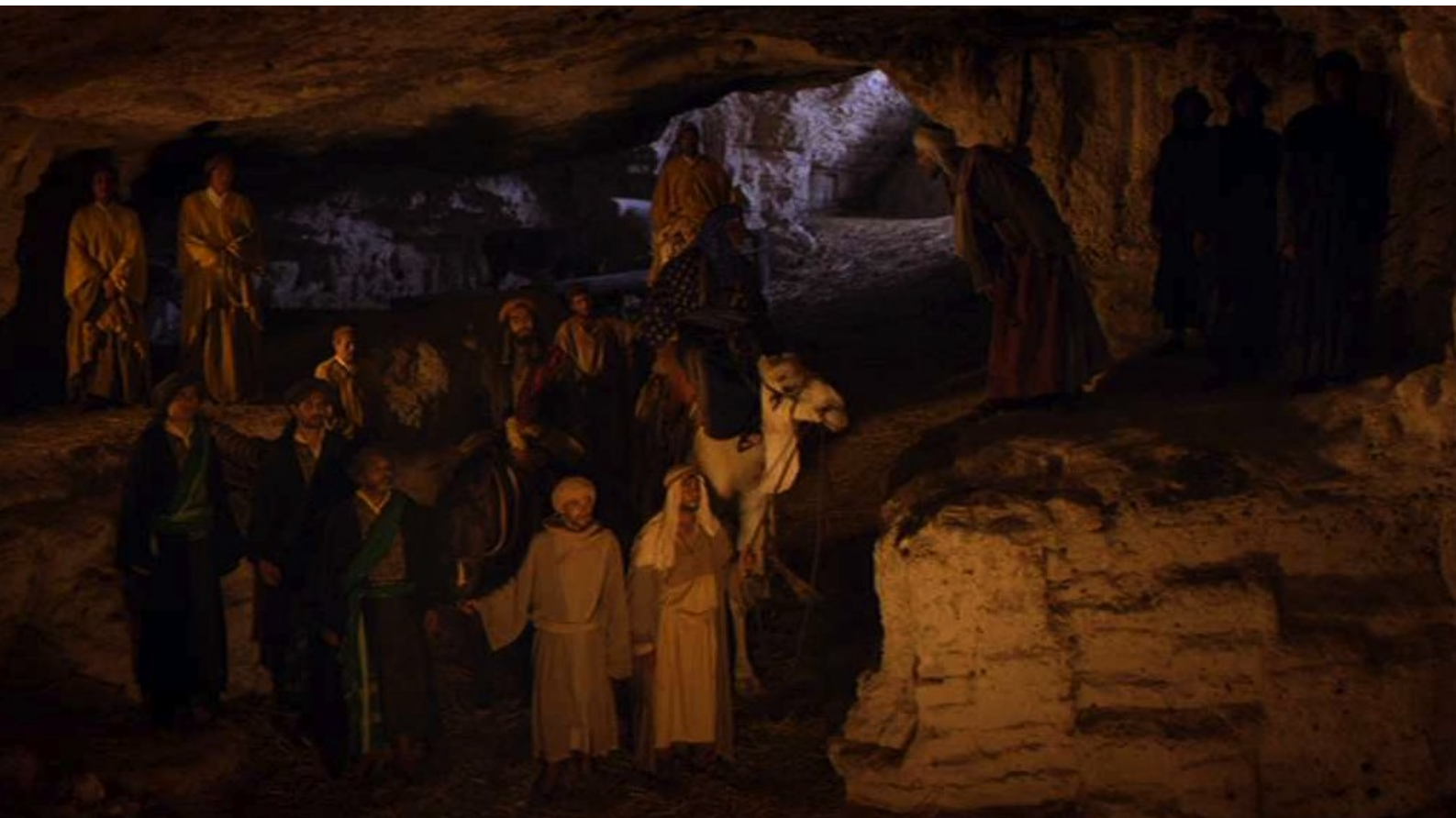
Maria di Nazaret : et l'adoration des Mages.