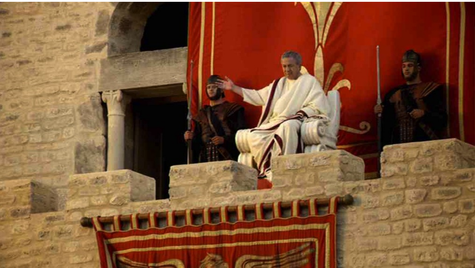
Maria di Nazaret : fait venir Jésus,