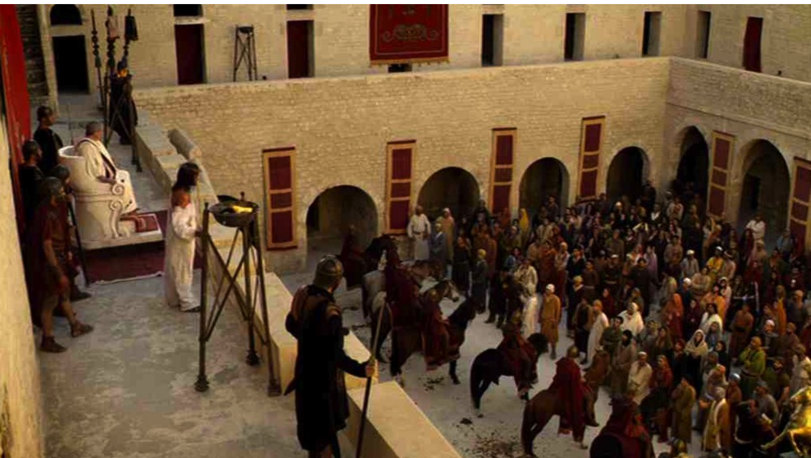
Maria di Nazaret : le présente au peuple en disant :