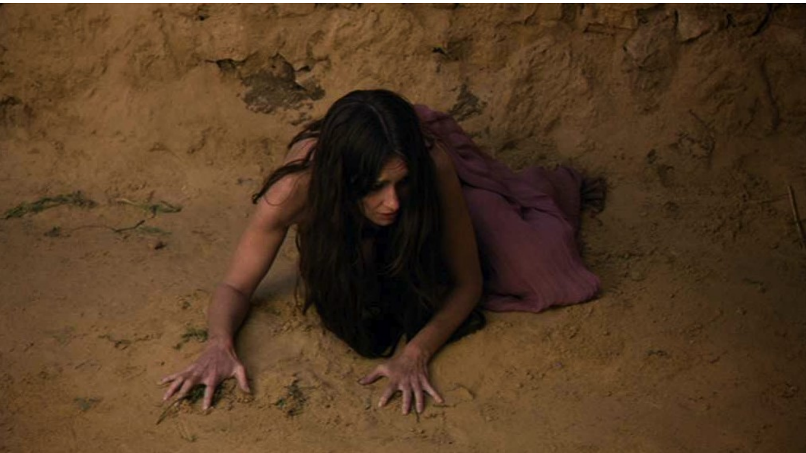
Maria di Nazaret : jetée au pied d'un mur