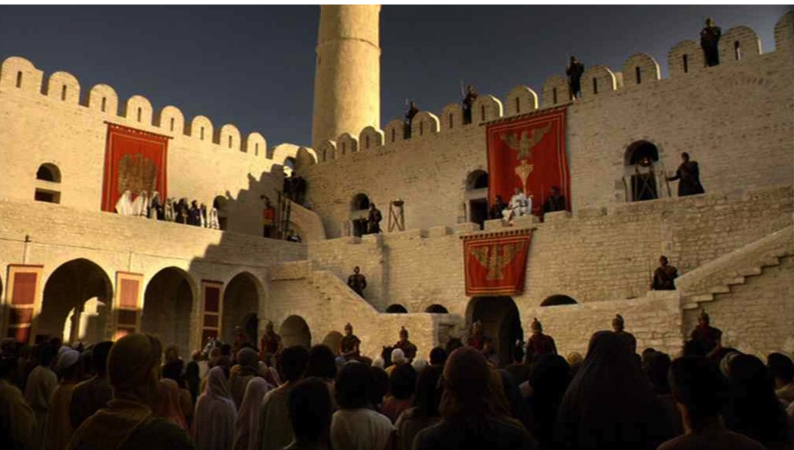
Maria di Nazaret : Pilate installe son tribunal,