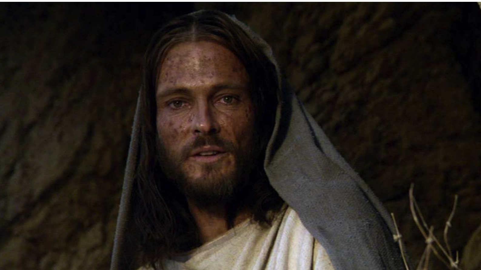
Maria di Nazaret : où le diable va le soumettre à la tentation