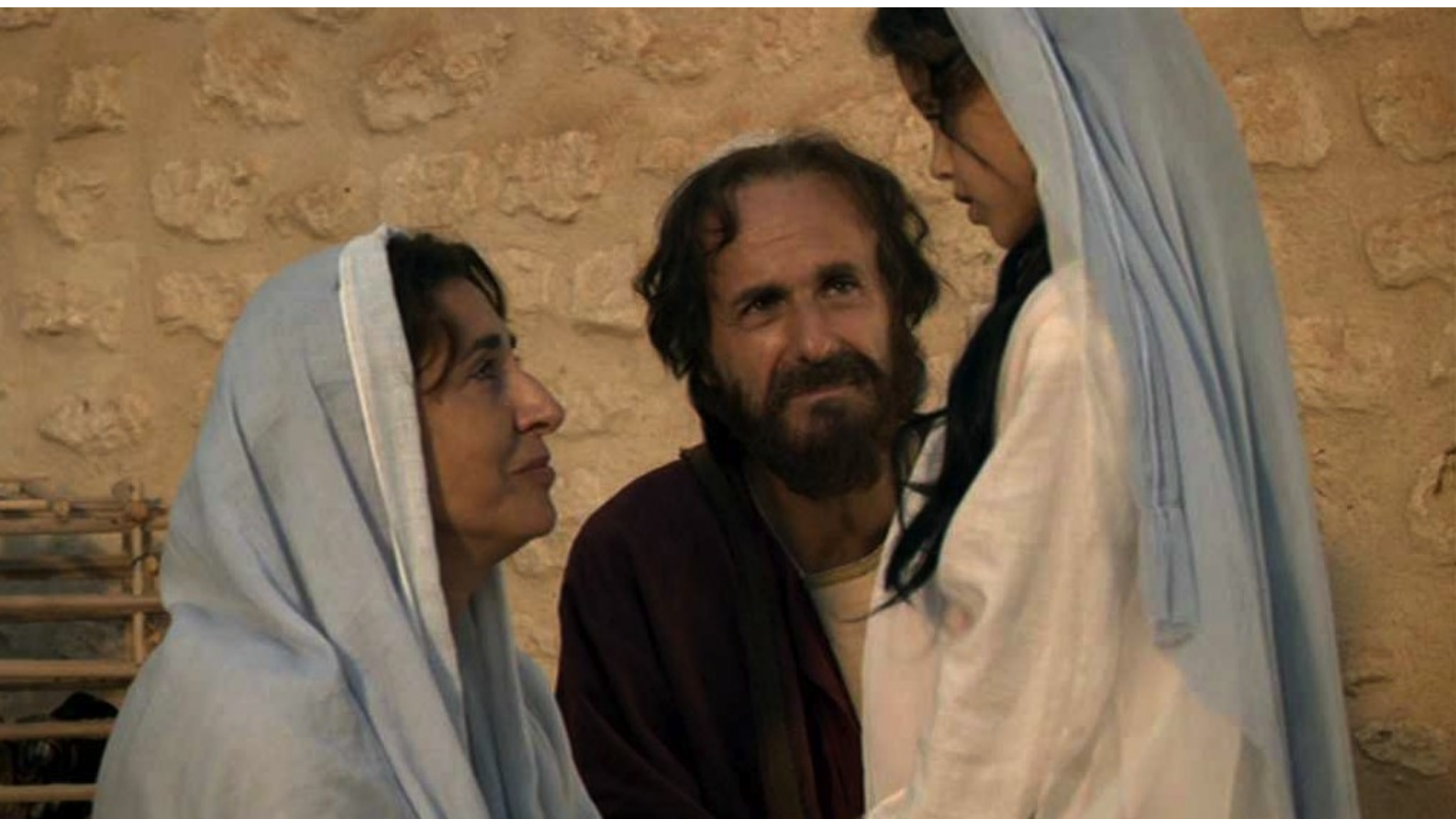
Maria di Nazaret : et Anne et Joachim, ses parents, qui s'occupent bien d'elle...