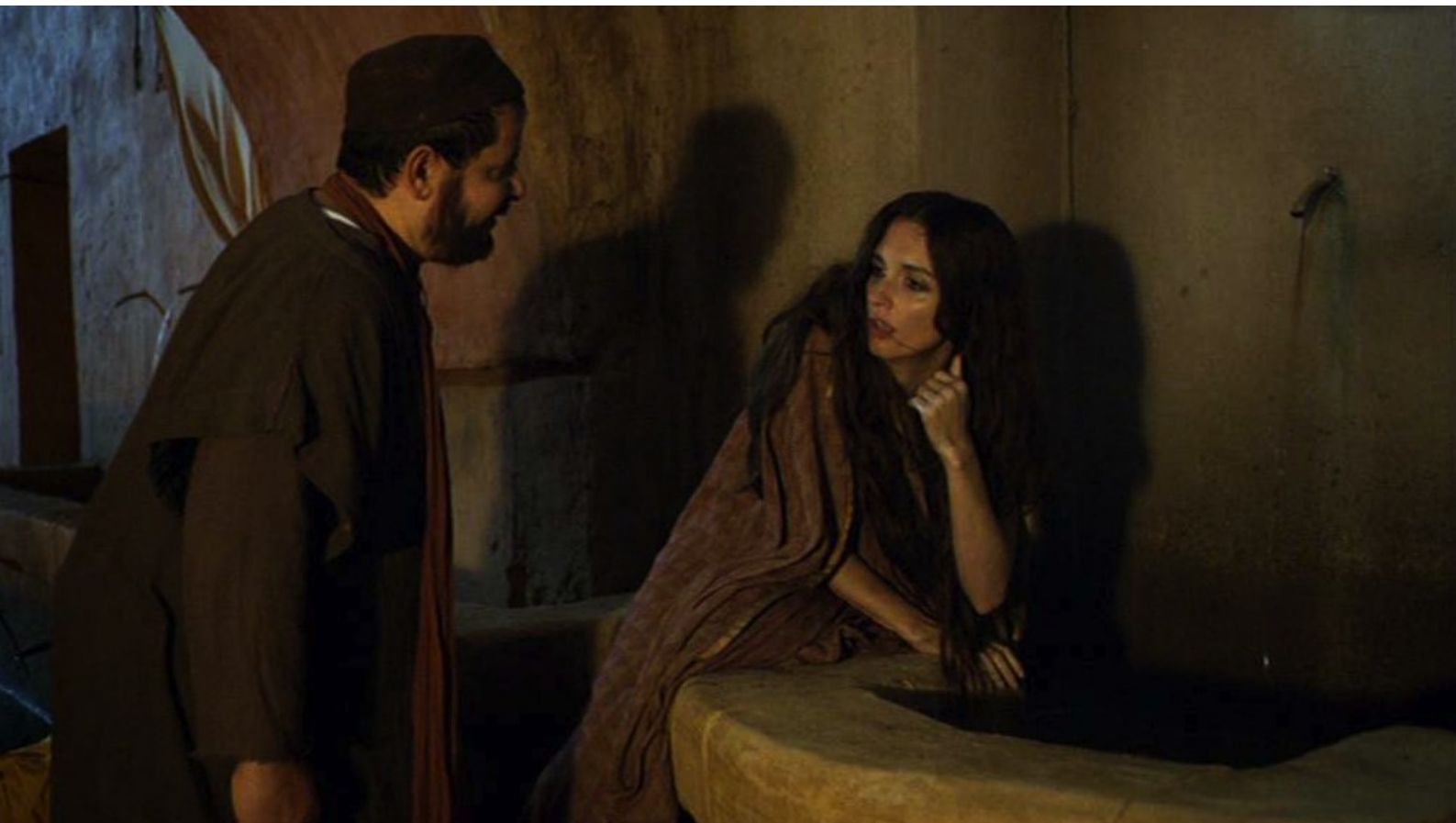
Maria di Nazaret : et, accostée par un inconnu, elle se laisse séduire.