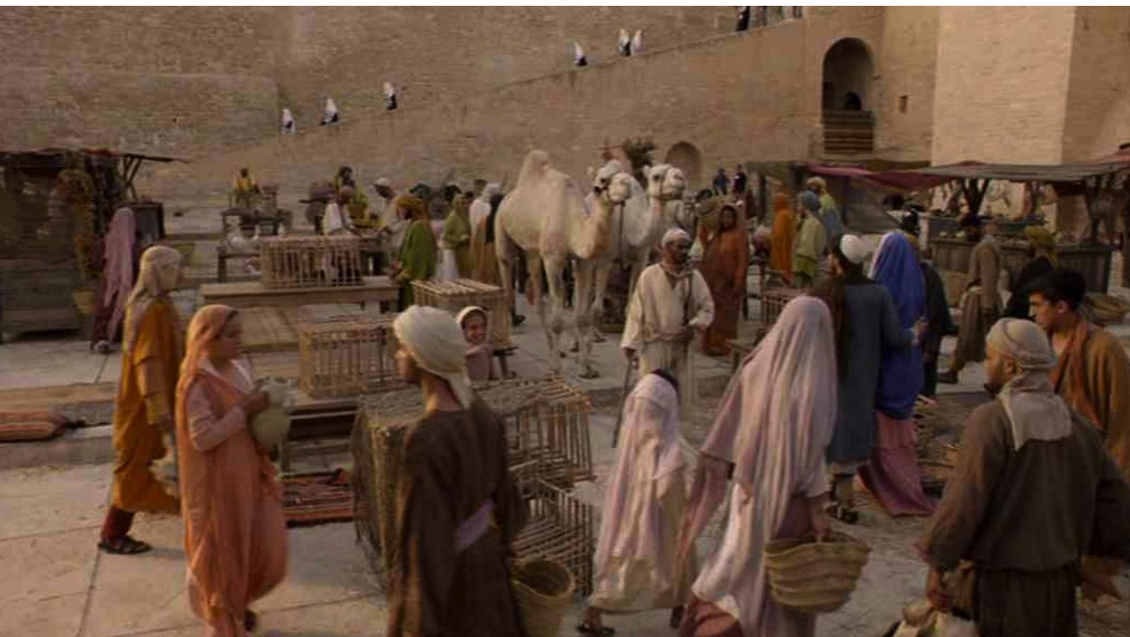
Maria di Nazaret : Puis la famille se rend sur le parvis du temple de Jérusalem