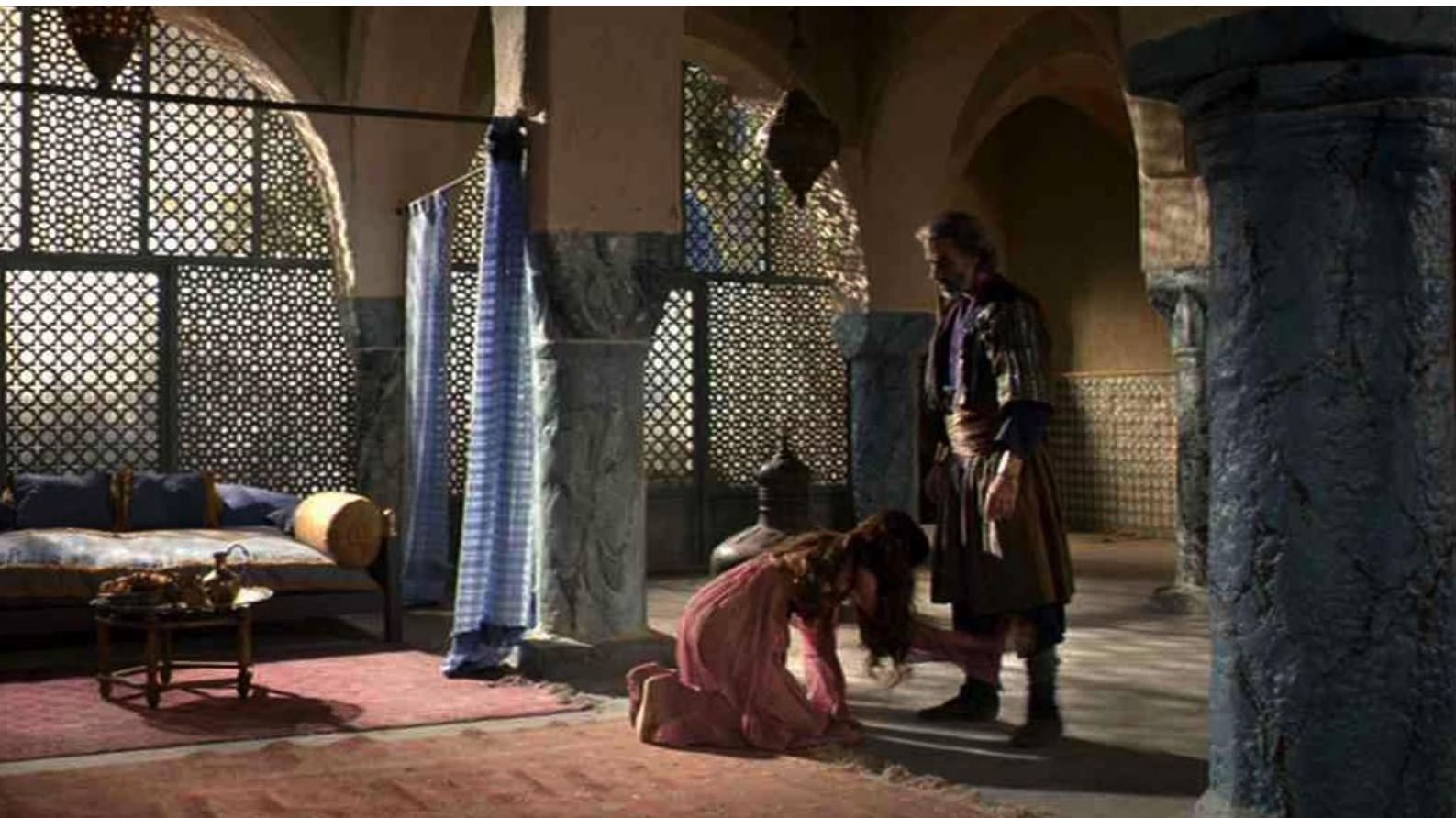
Maria di Nazaret : ce qui afflige fortement Madeleine