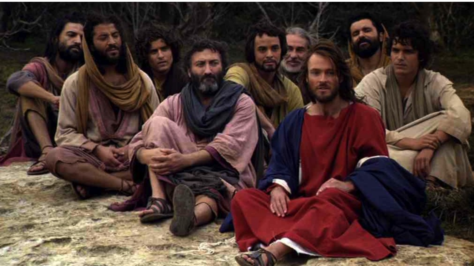
Maria di Nazaret : il recrute des disciples,