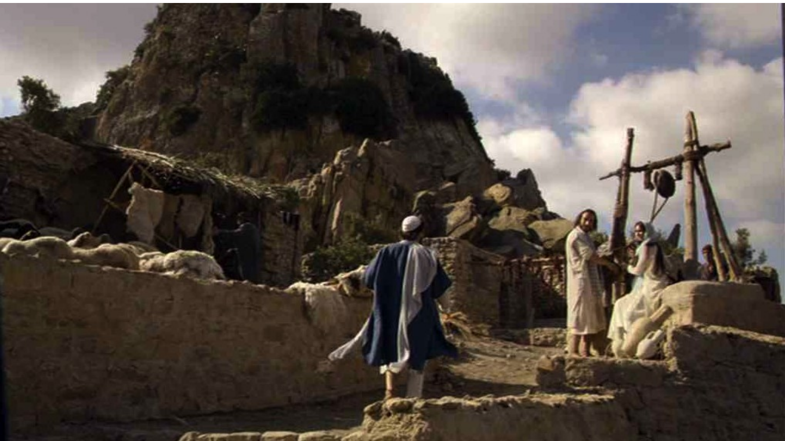
Maria di Nazaret : près du puits