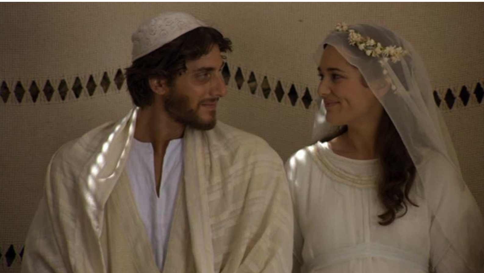
Maria di Nazaret : Joseph accepte