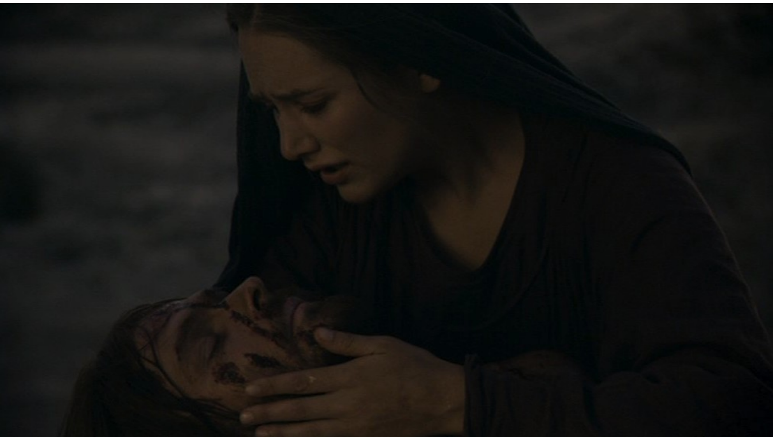
Maria di Nazaret : que Marie embrasse tendrement