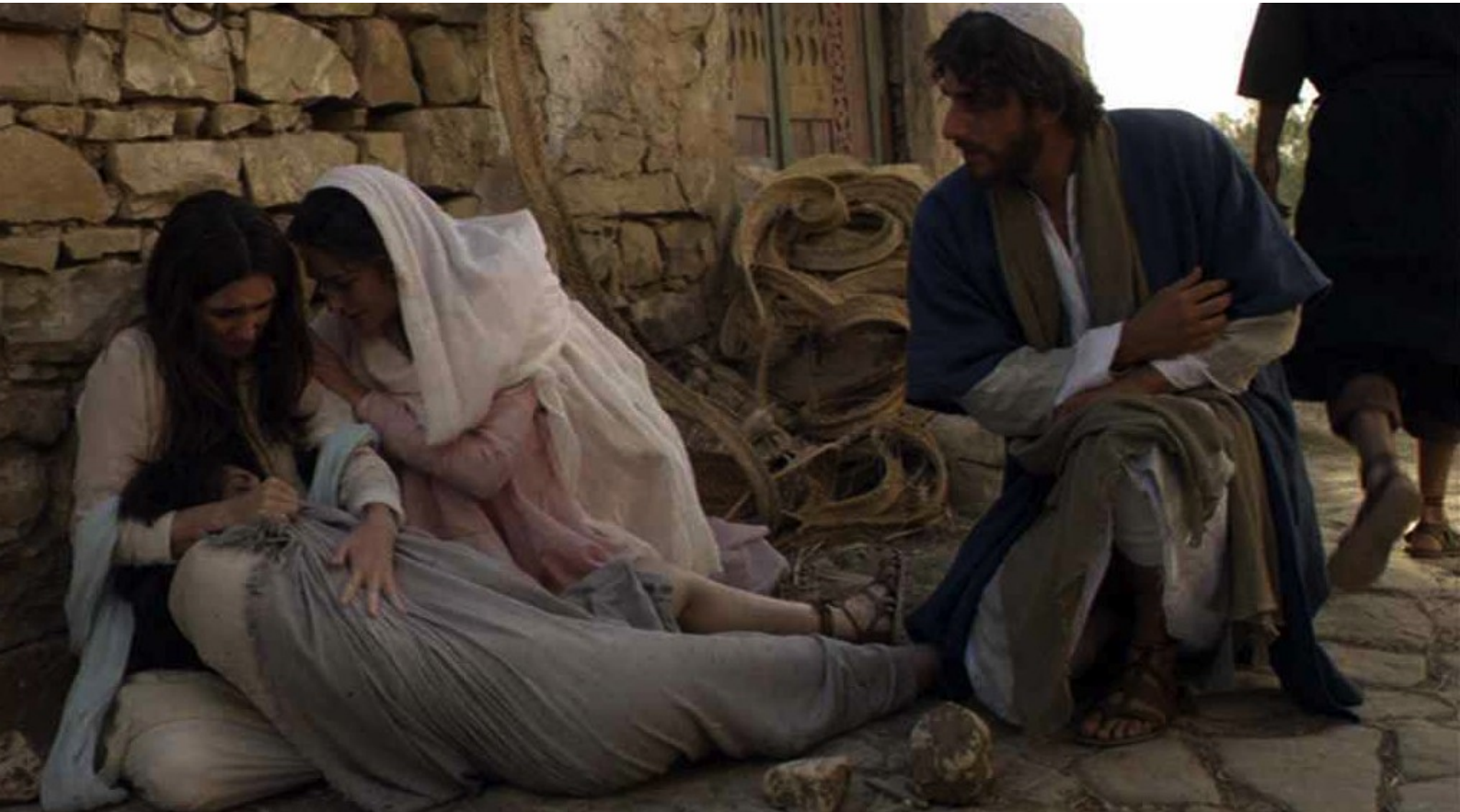
Maria di Nazaret : et, traumatisée par ce deuil,