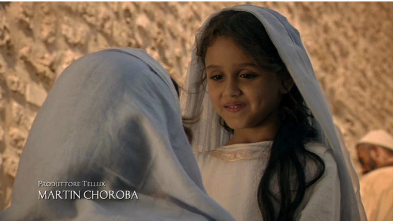
Maria di Nazaret : ... quand elle est encore une enfant.