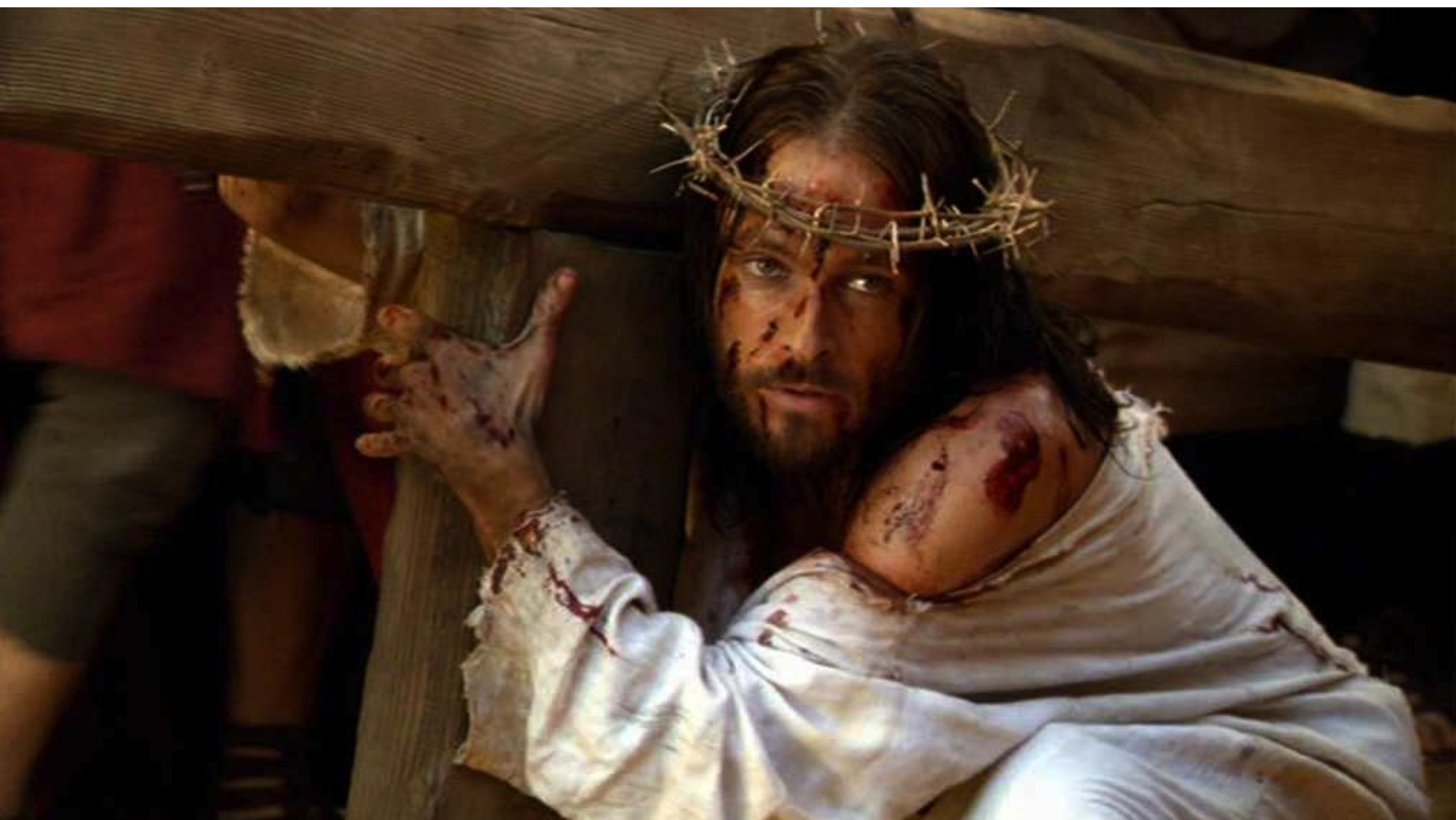
Maria di Nazaret : sous le poids de laquelle il tombe,