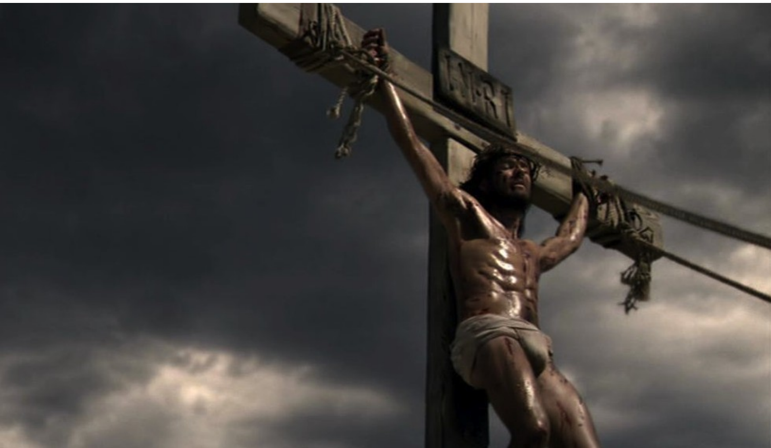
Maria di Nazaret : sur laquelle il mourra.