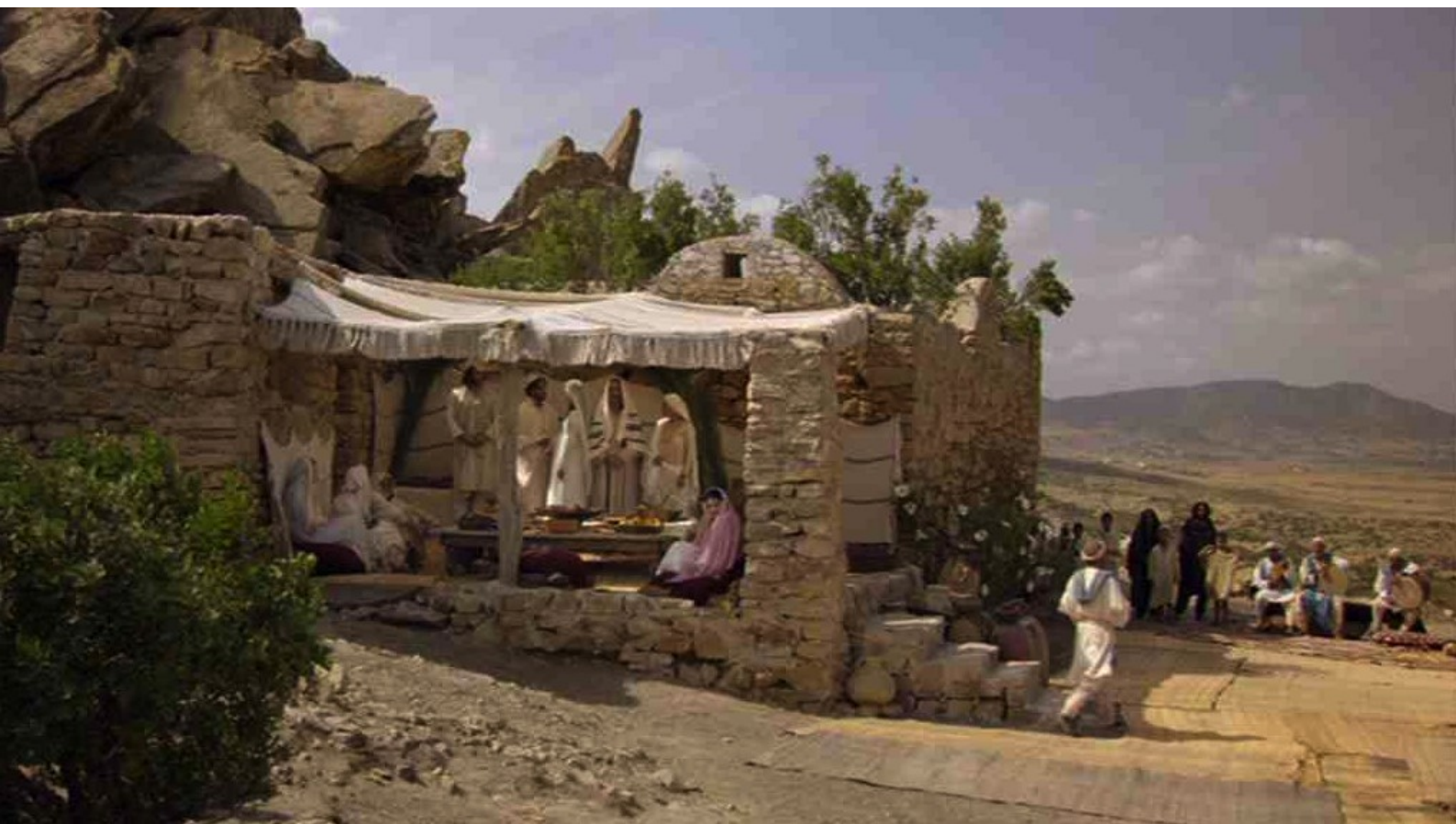
Maria di Nazaret : d'épouser Marie.