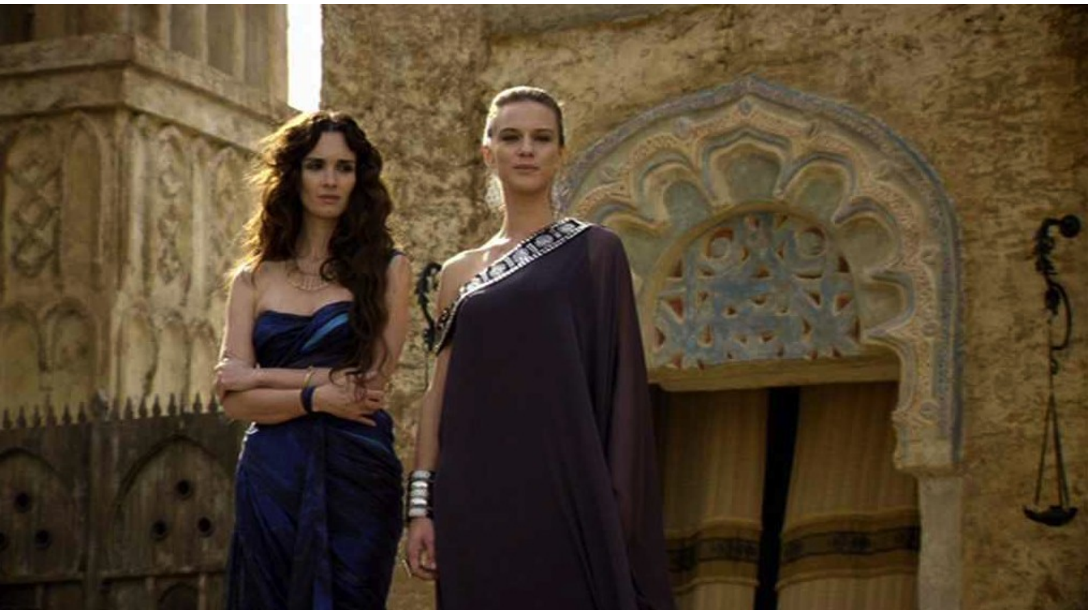
Maria di Nazaret : et d'Hérodiade.