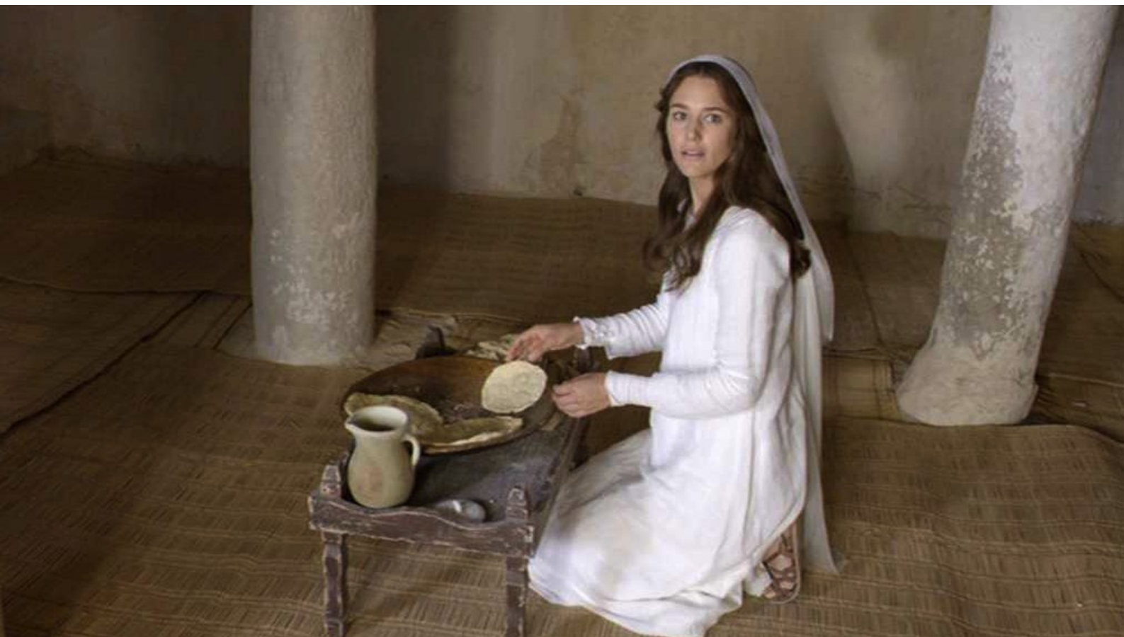
Maria di Nazaret : Mais un ange annonce à Marie qu'elle va être enceinte.