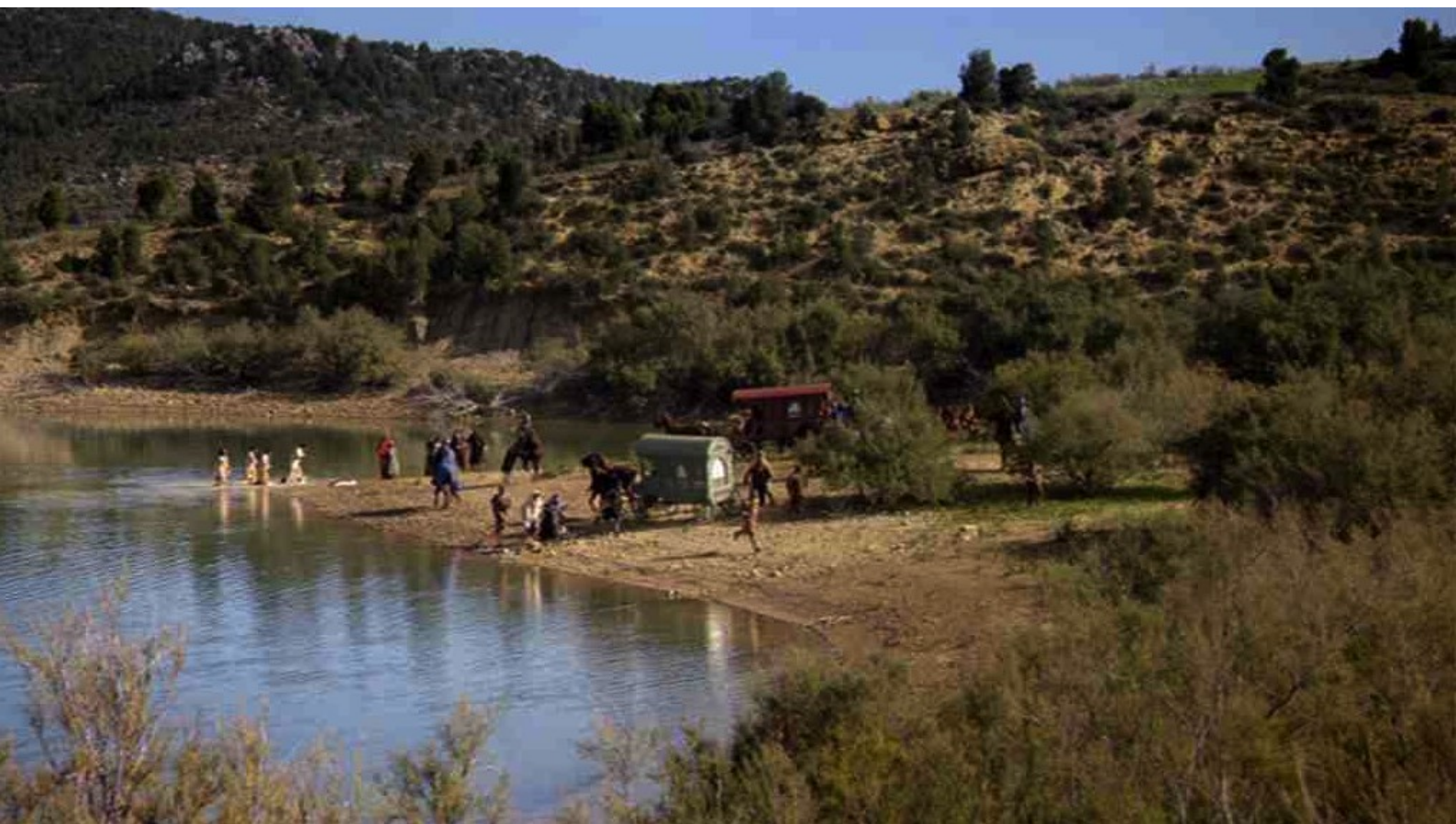
Maria di Nazaret : Hérode Antipas lui aussi vient voir Jean