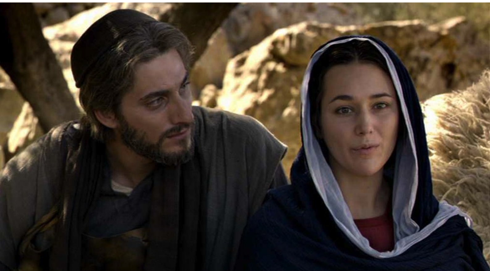
Maria di Nazaret : Mais Joseph, qui se fait vieux,