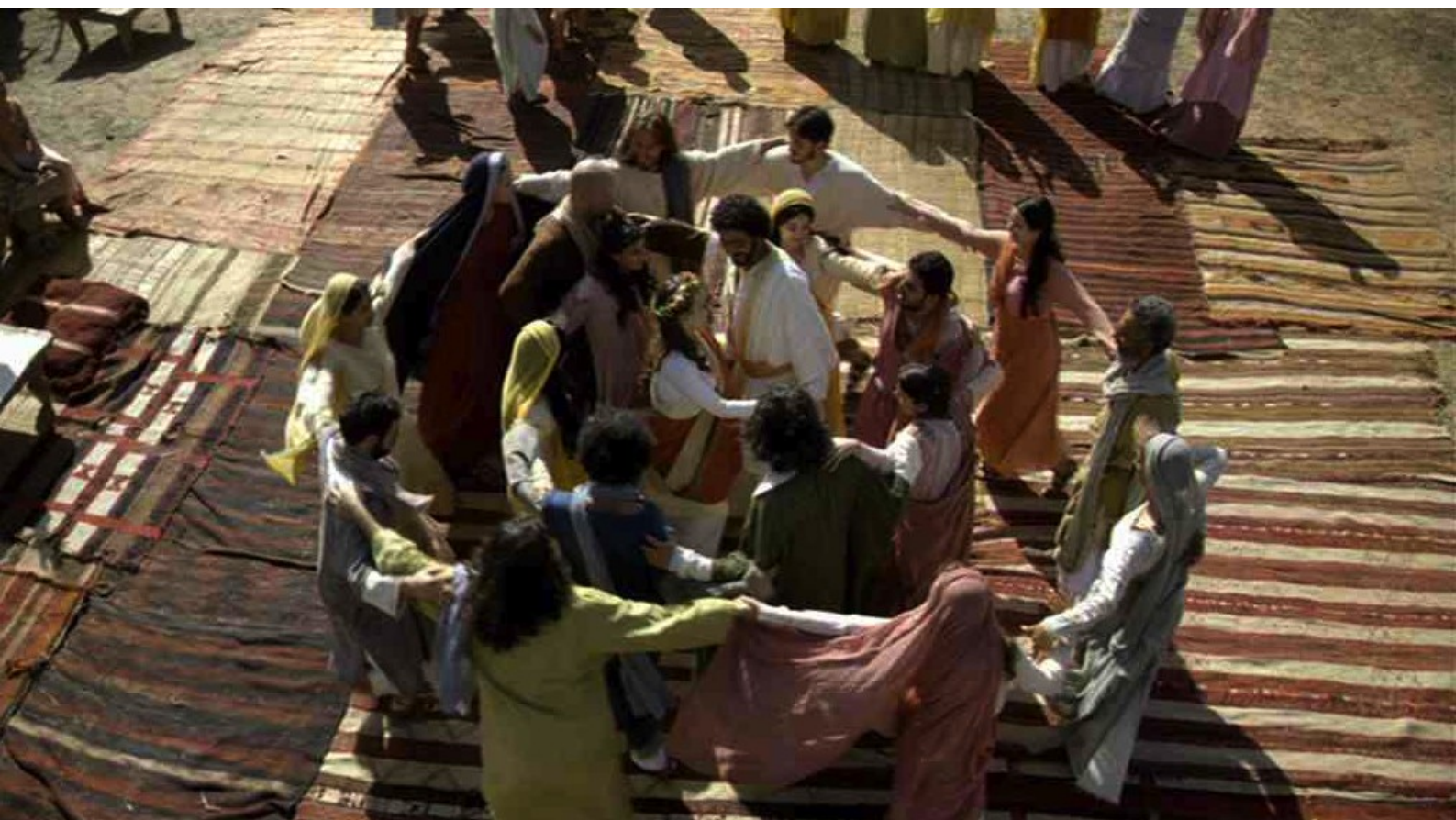
Maria di Nazaret : Pendant ce temps, Jésus commence son ministère aux noces de Cana,