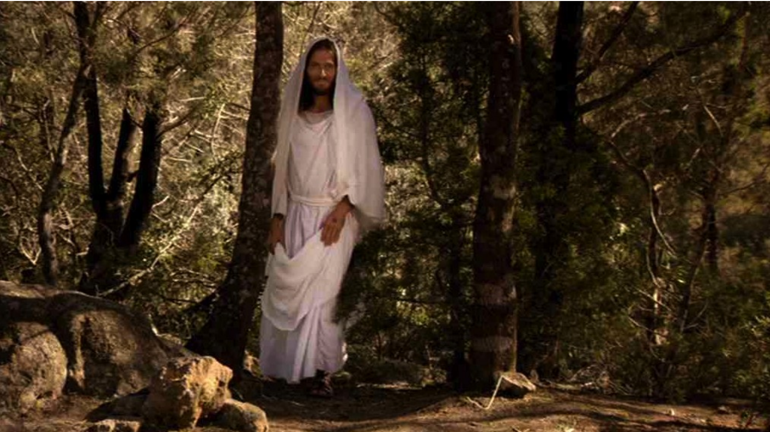
Maria di Nazaret : Jésus se présente à elle, ressuscité.