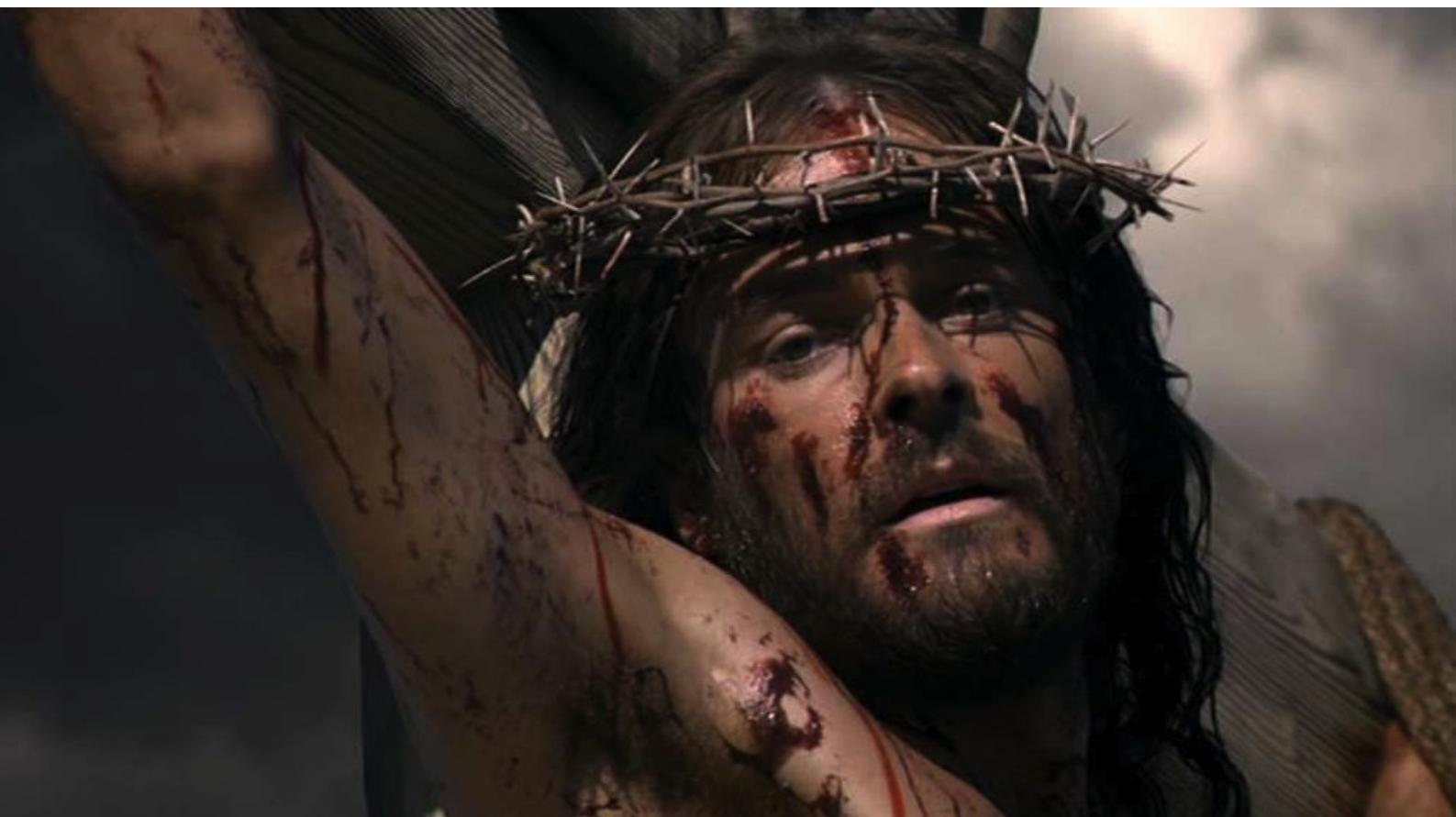
Maria di Nazaret : Puis on va emmener Jésus,