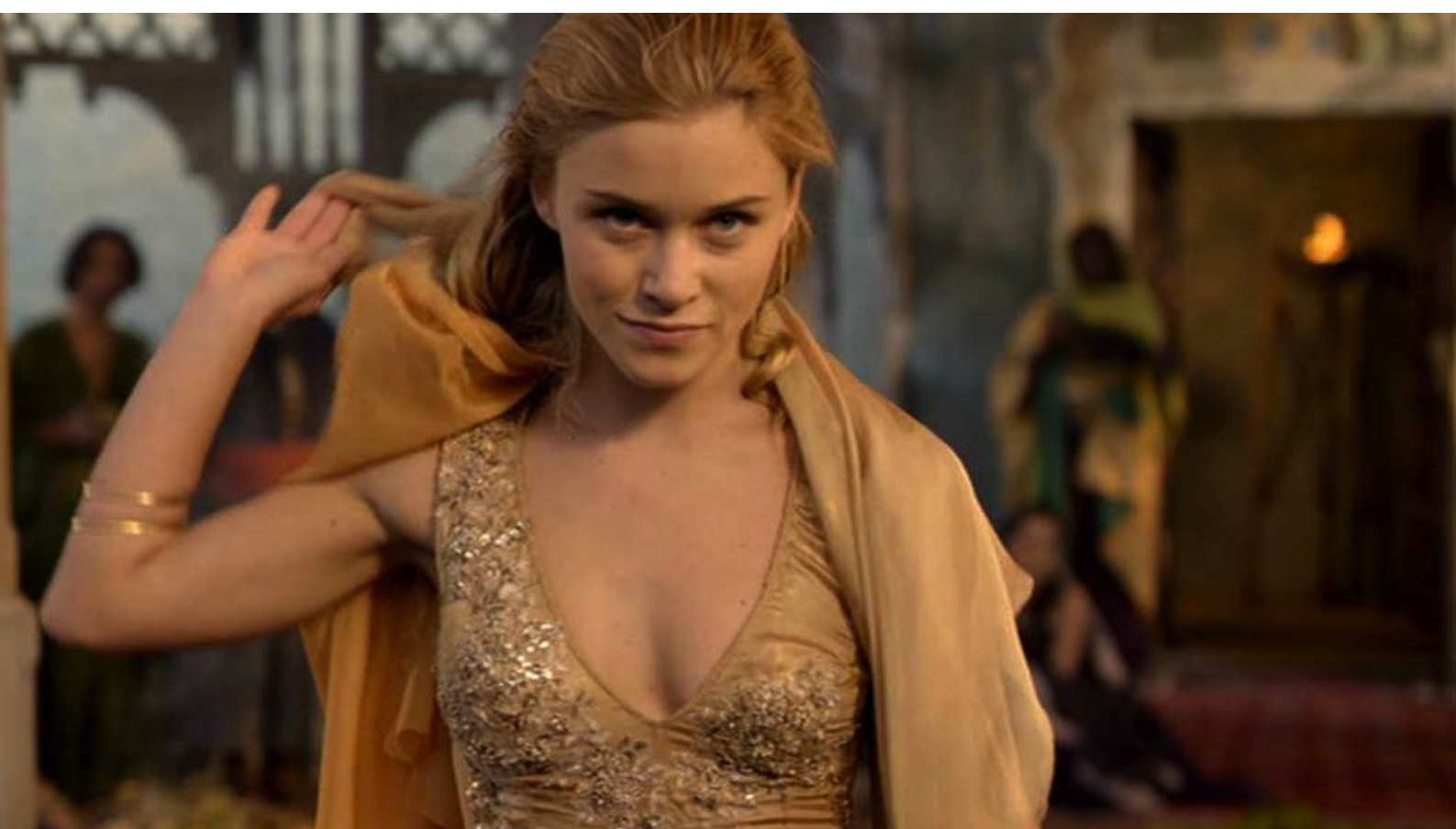
Maria di Nazaret : et à se dévoiler