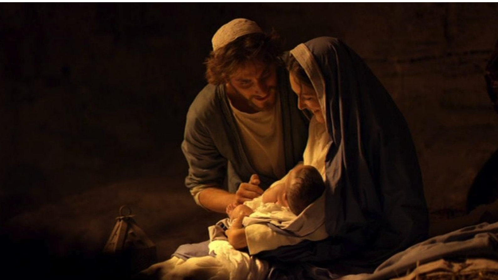
Maria di Nazaret : le bonheur familial,