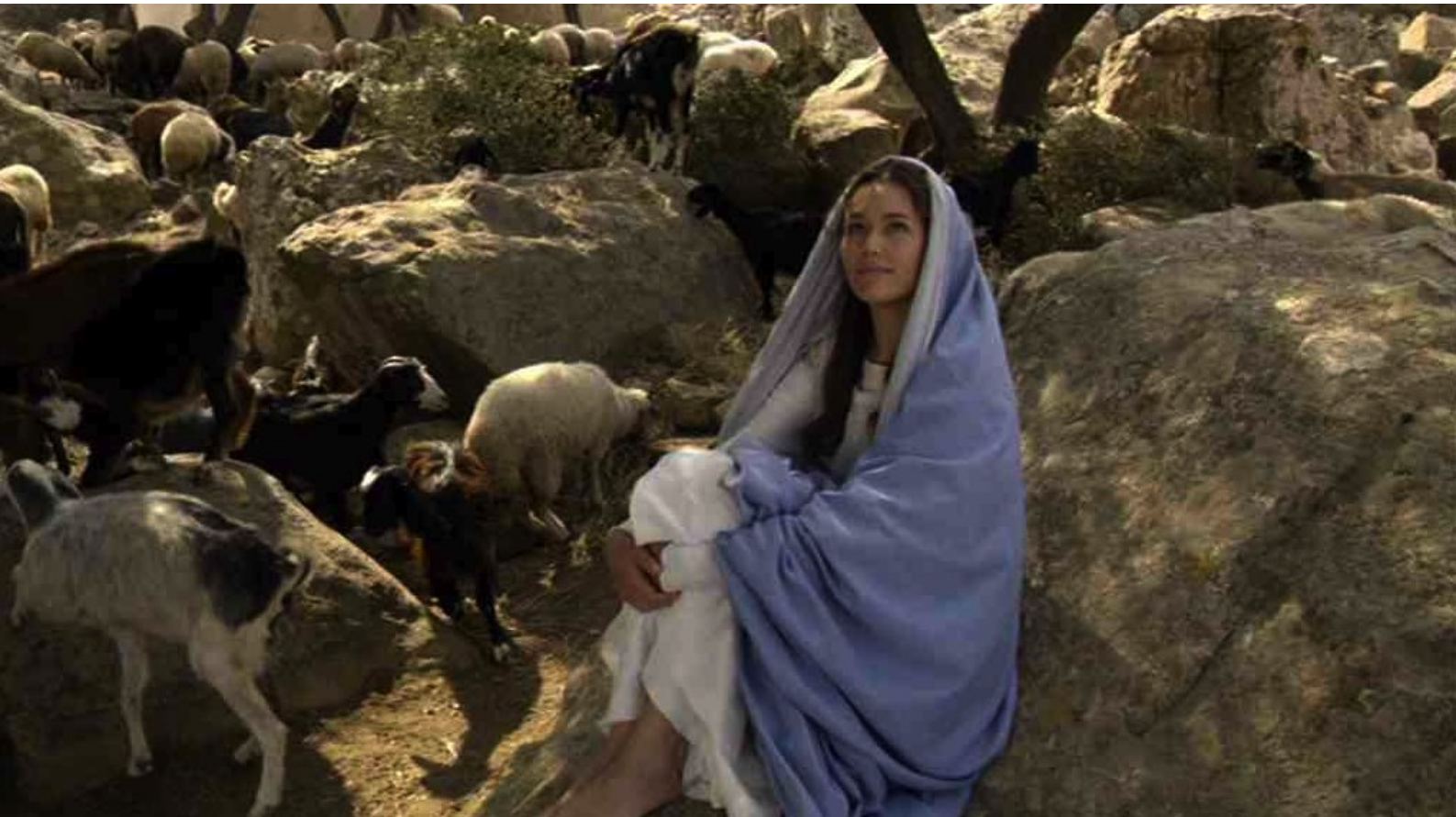
Maria di Nazaret : et la courtise