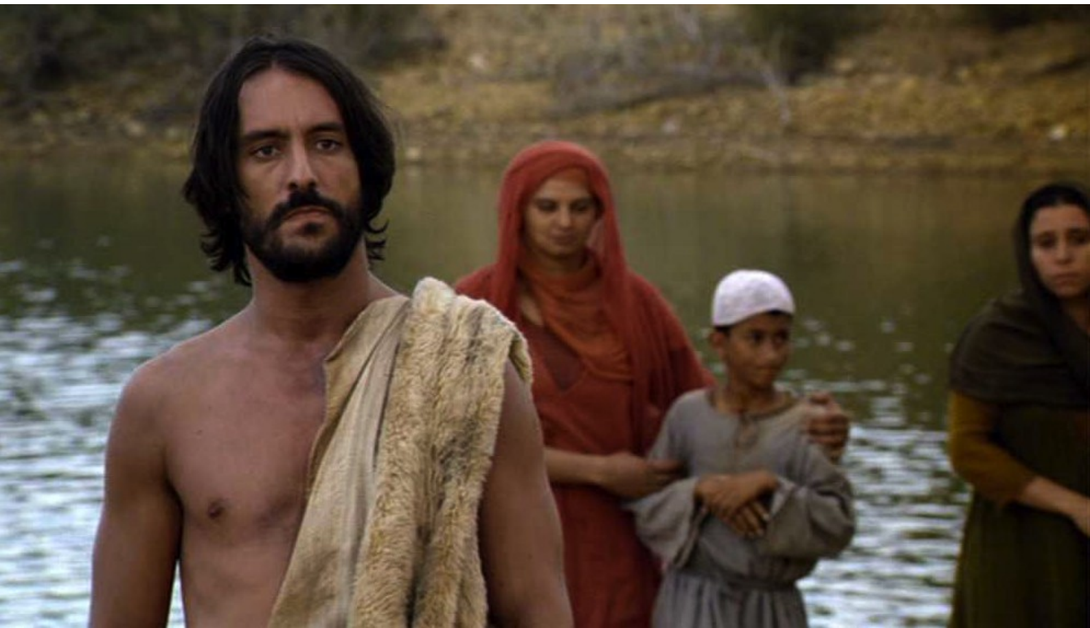
Maria di Nazaret : pour se faire baptiser.