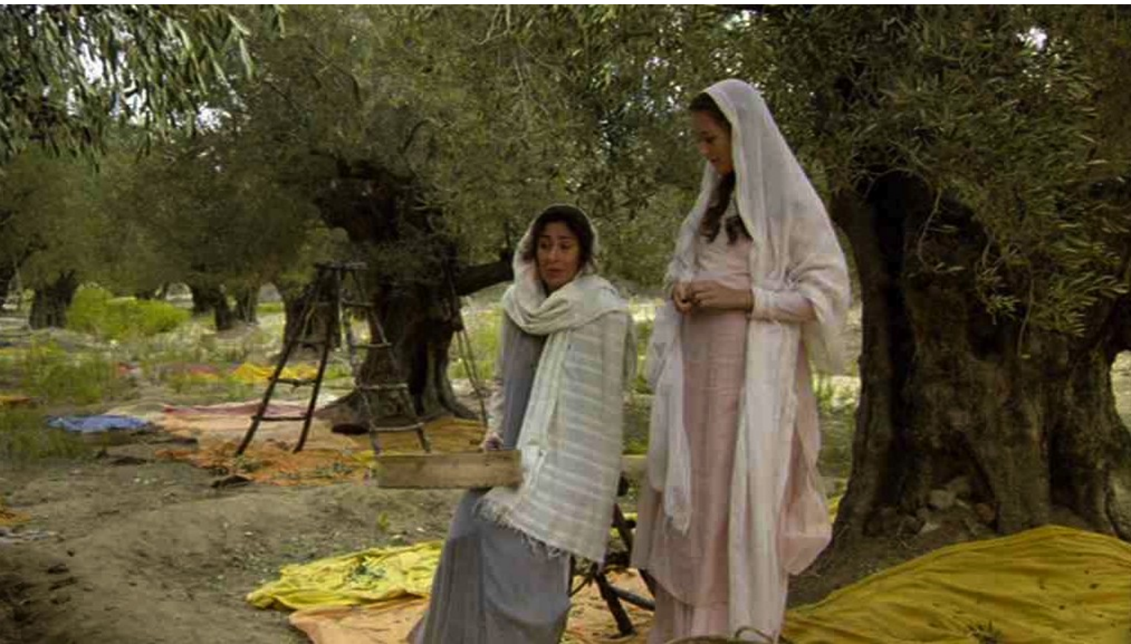
Maria di Nazaret : Anne lui garde son affection