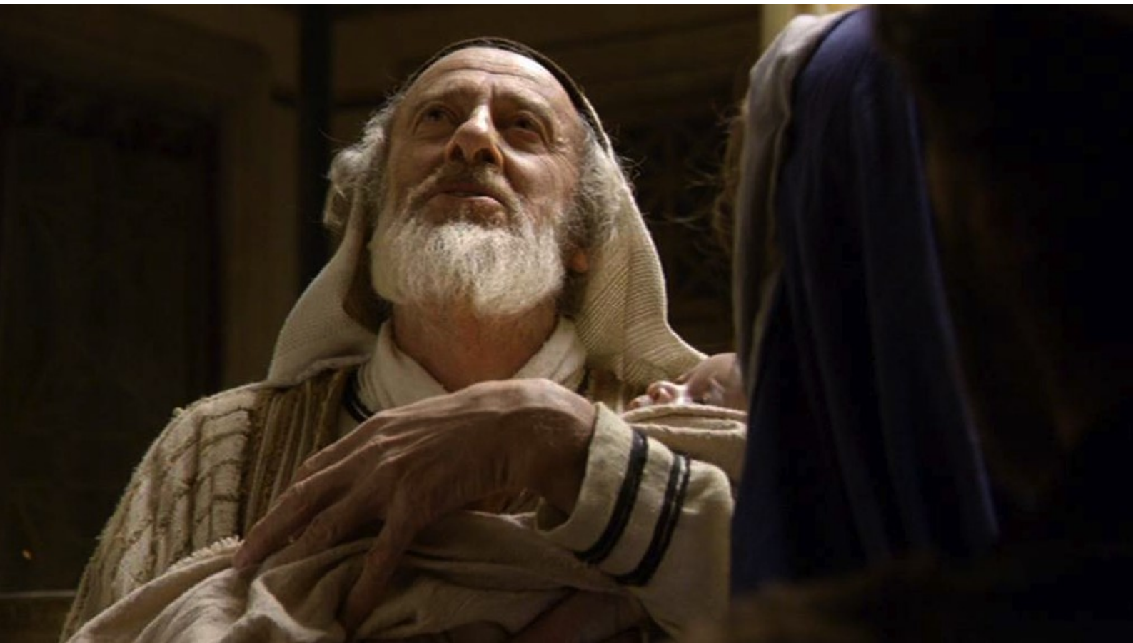
Maria di Nazaret : où le vieux Siméon bénit l'enfant.