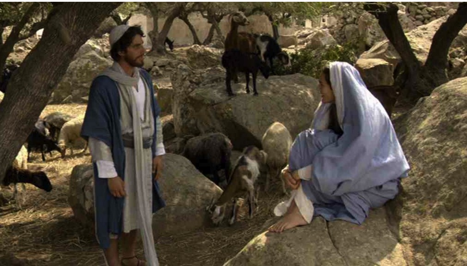
Maria di Nazaret : pendant des mois.