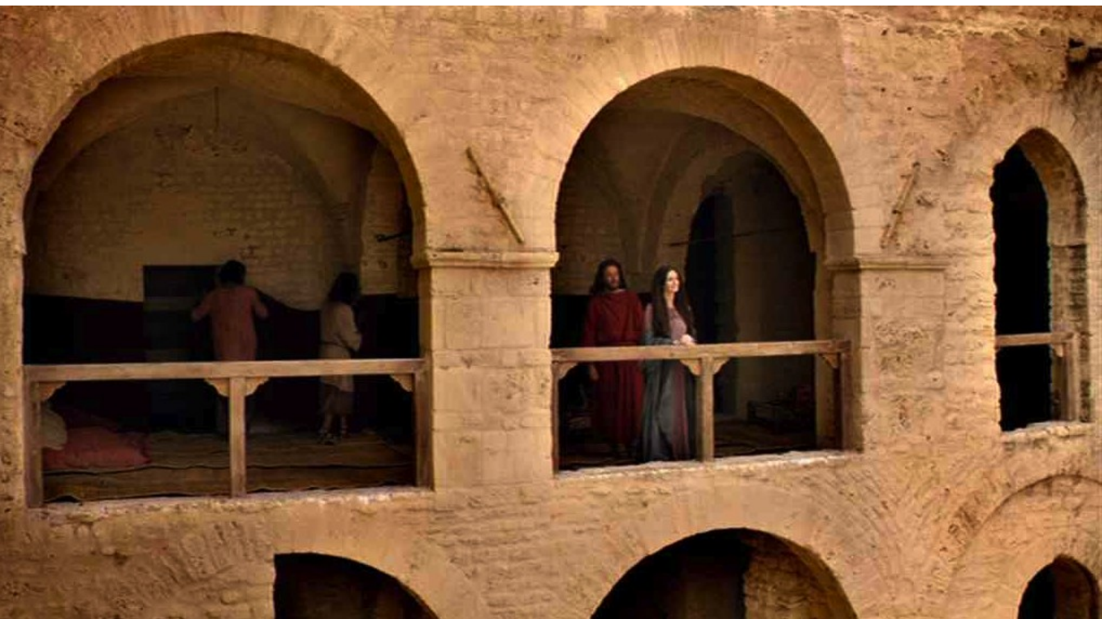
Maria di Nazaret : mais Jésus vient vers elle