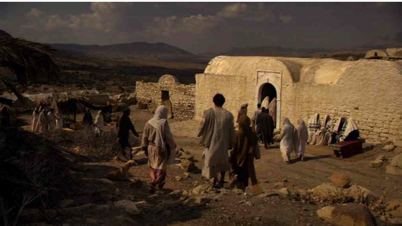
Maria di Nazaret : Il retourne à la synagogue de Nazareth