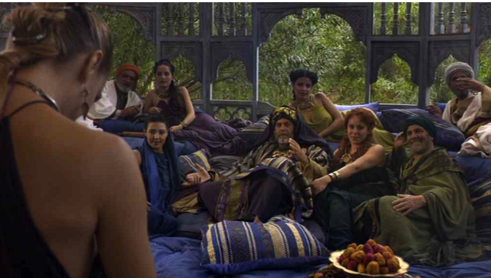
Maria di Nazaret : à la cour d'Hérode le Grand