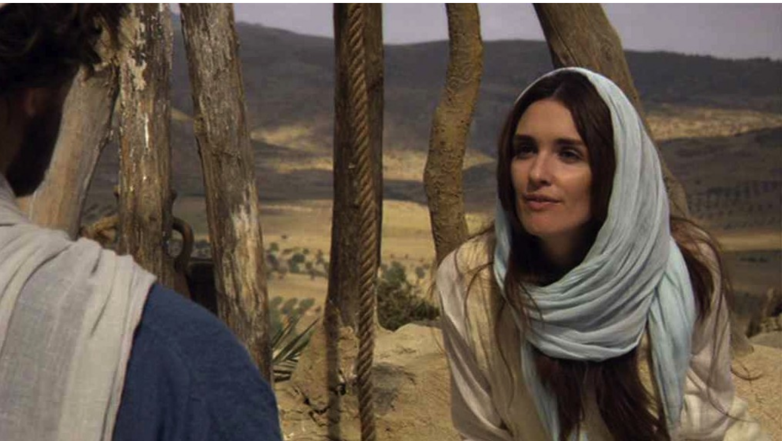
Maria di Nazaret : Madeleine, son amie