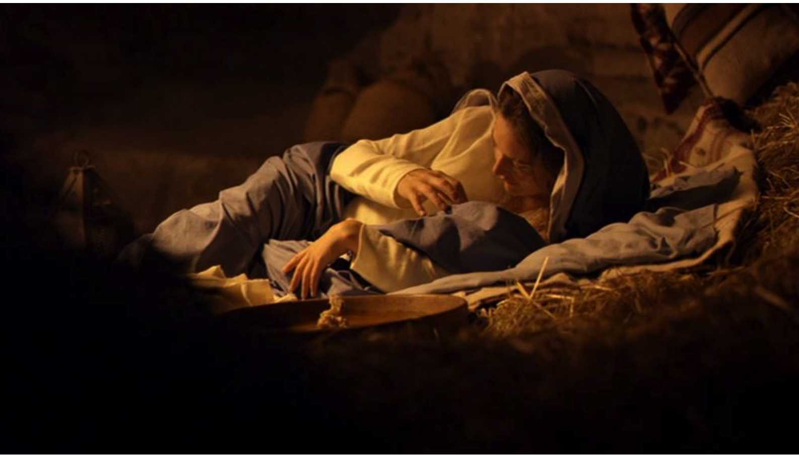
Maria di Nazaret : la naissance de Jésus,