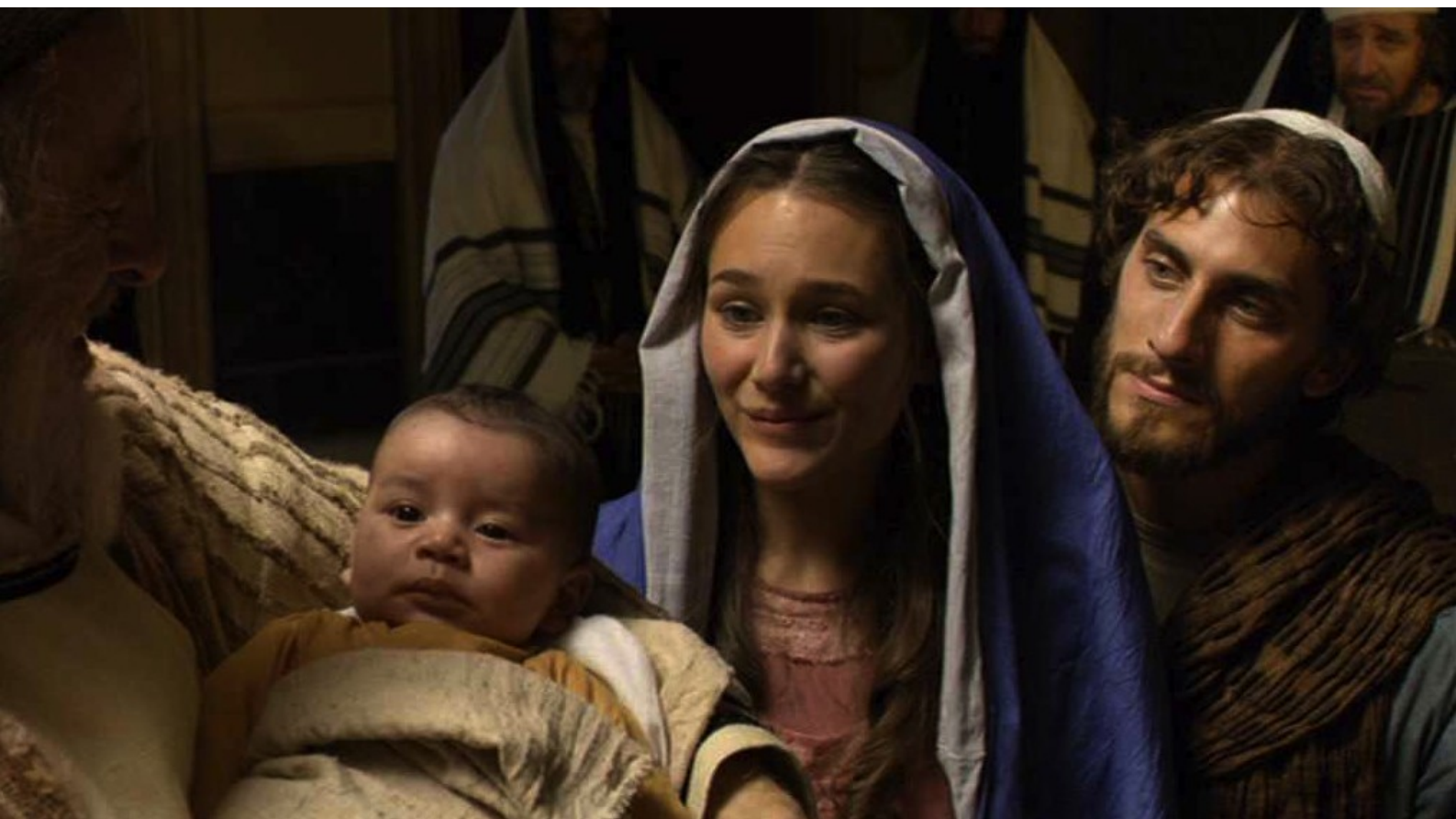
Maria di Nazaret : leur accueil