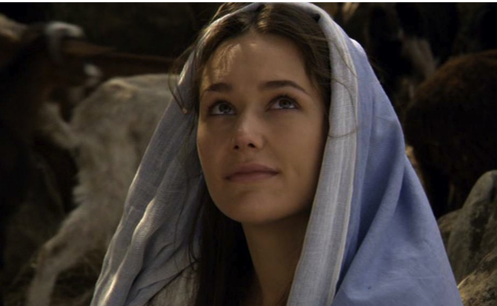
Maria di Nazaret : Marie