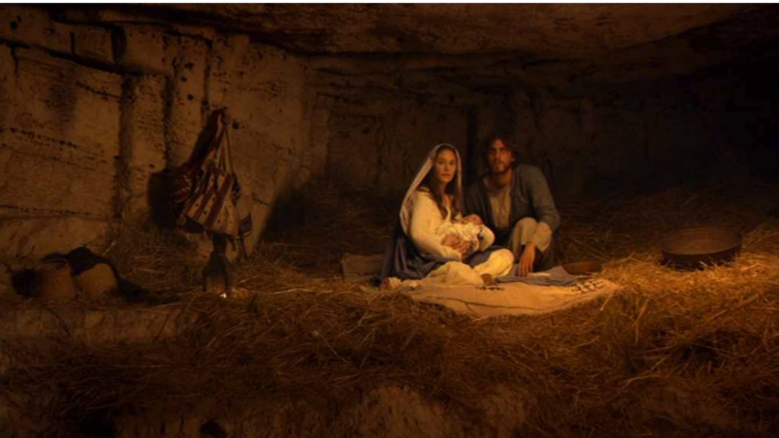
Maria di Nazaret : l'arrivée des bergers,