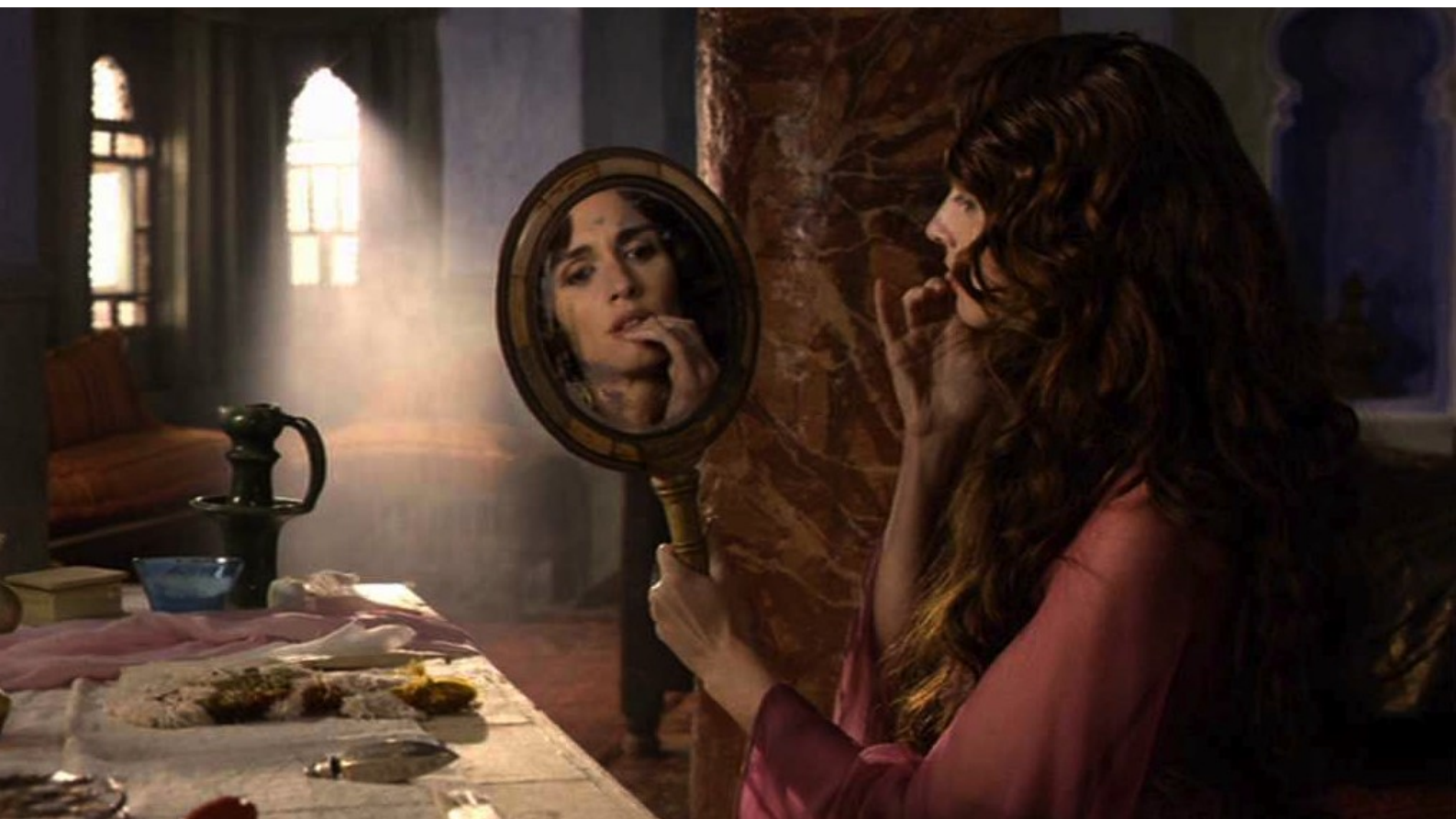
Maria di Nazaret : De son côté, Madeleine est tourmentée par la mort de Jean-Baptiste