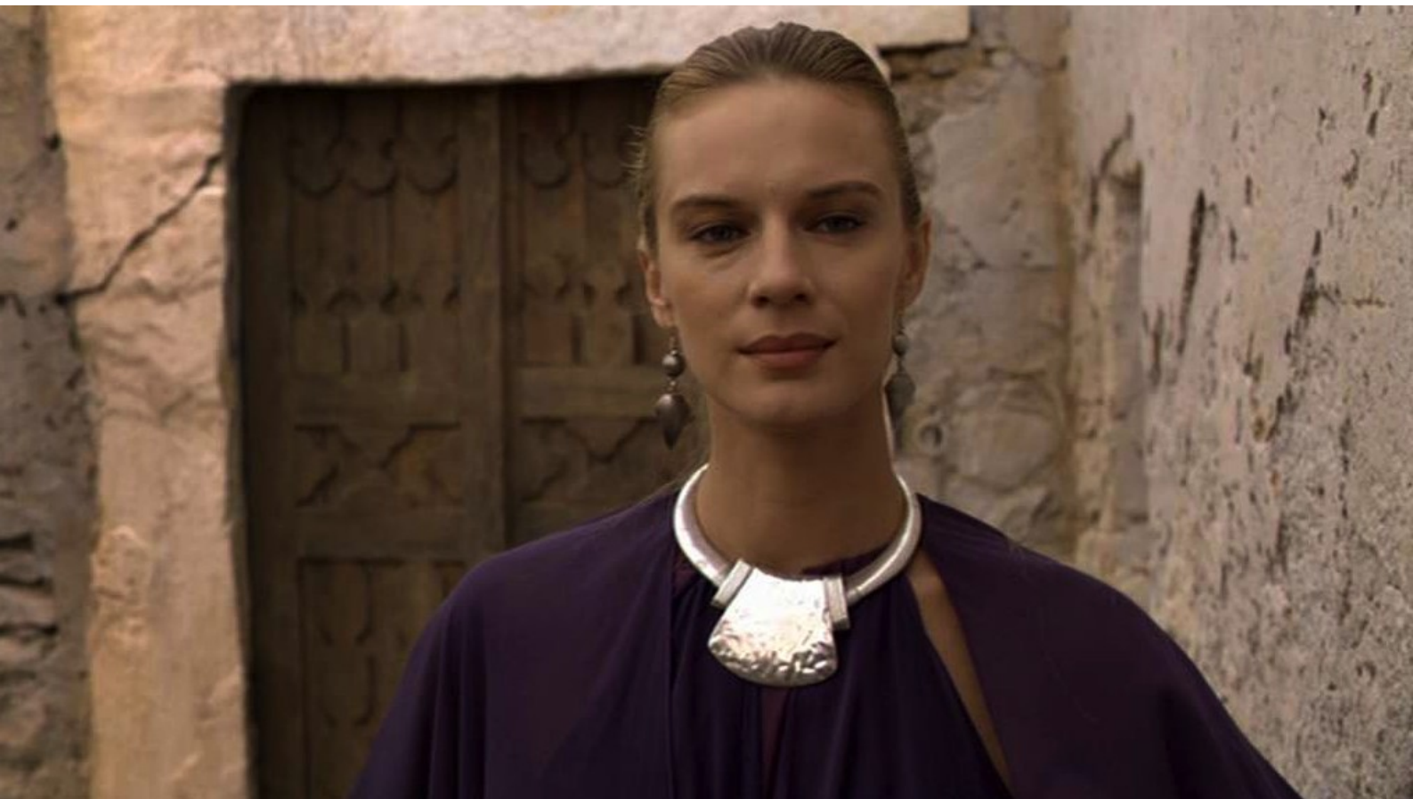
Maria di Nazaret : se laisse emmener par la reine Hérodiade