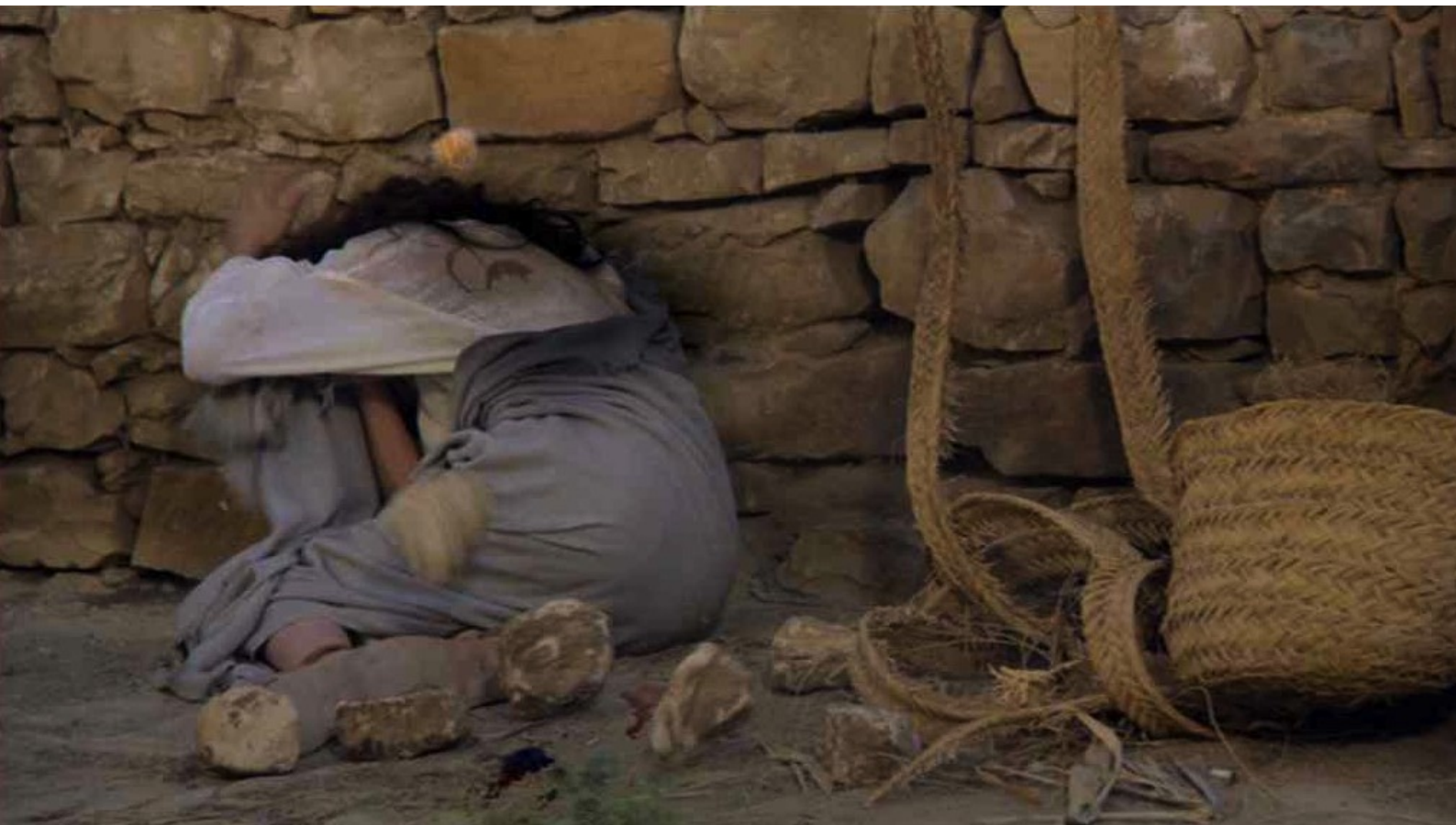
Maria di Nazaret : Son amie d'enfance voit lapider sa mère