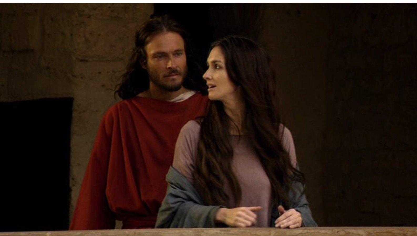
Maria di Nazaret : et lui permet de le suivre.