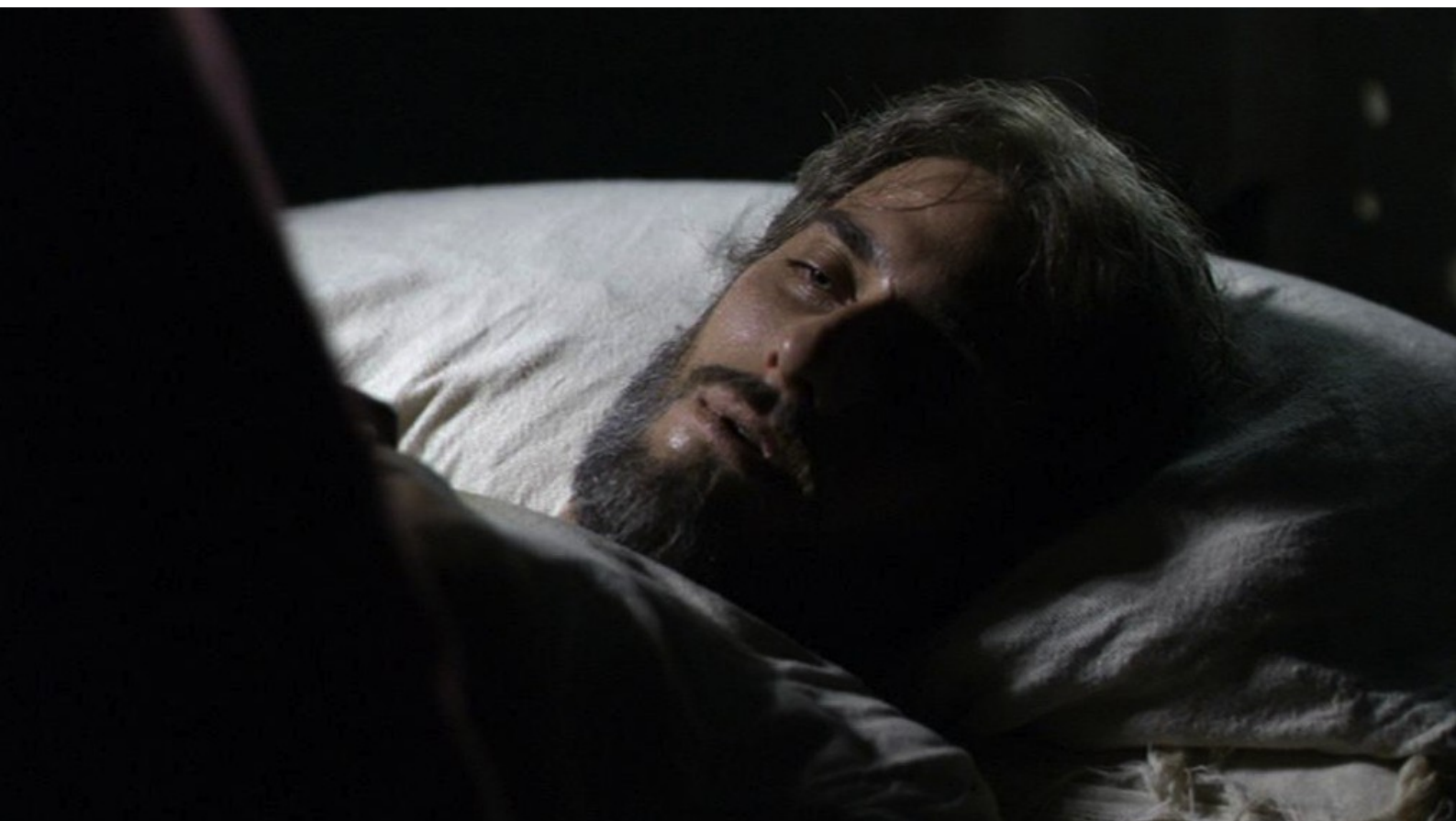
Maria di Nazaret : est à l'article de la mort