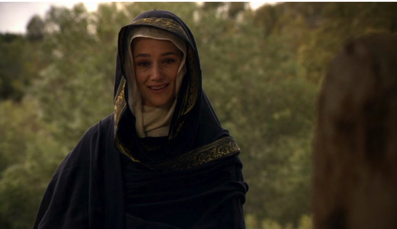
Maria di Nazaret : avant de rentrer en pleurs