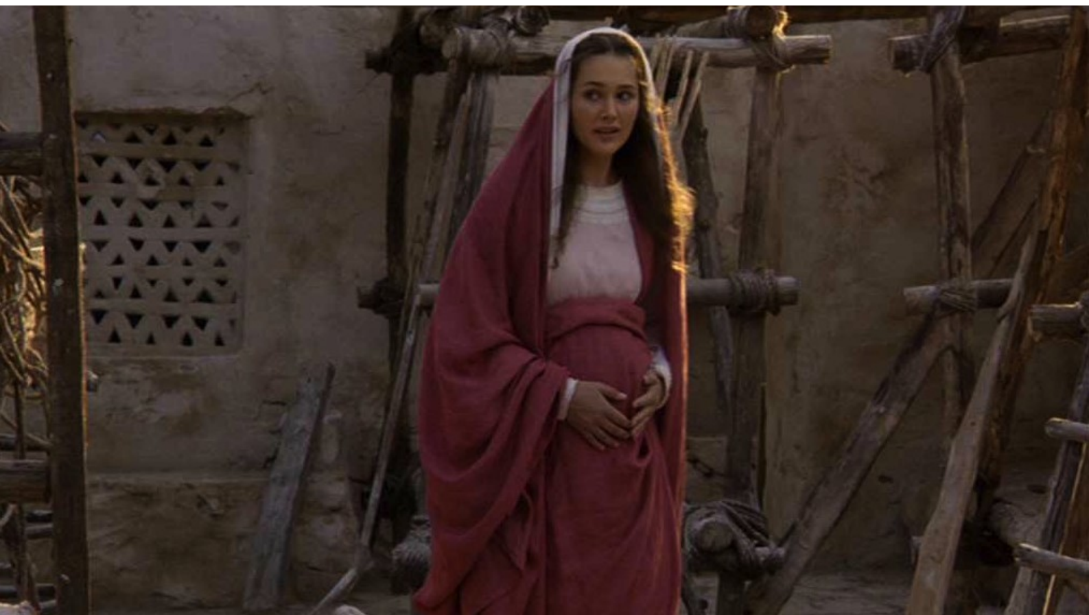
Maria di Nazaret : et, malgré le scandale,