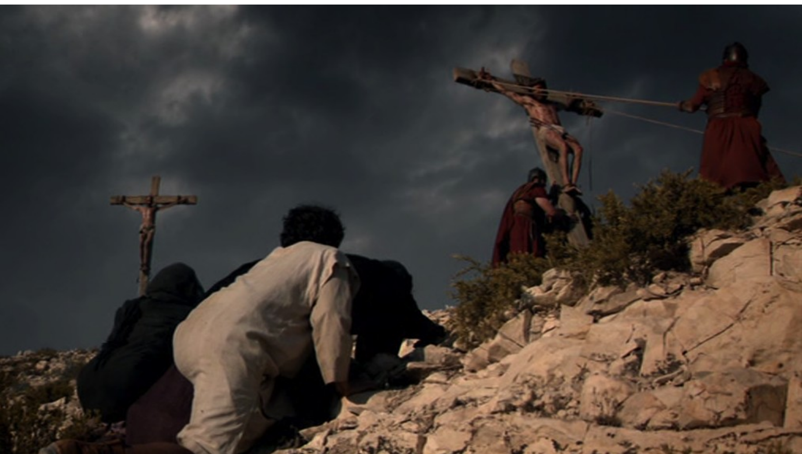
Maria di Nazaret : On dresse sa croix