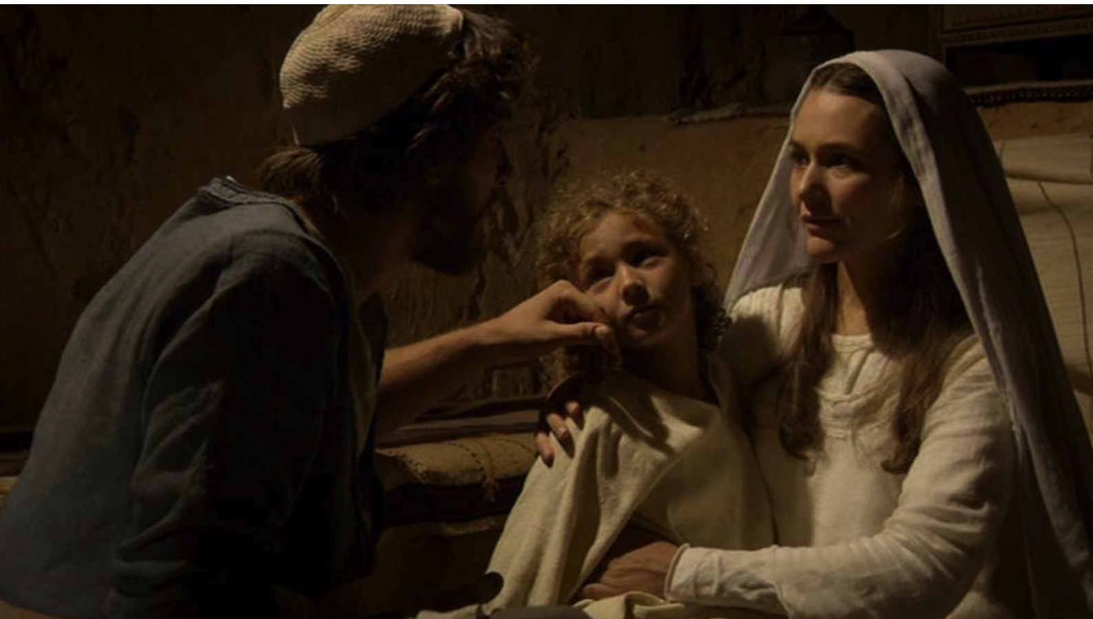
Maria di Nazaret : où la famille pourra vivre une vie paisible.