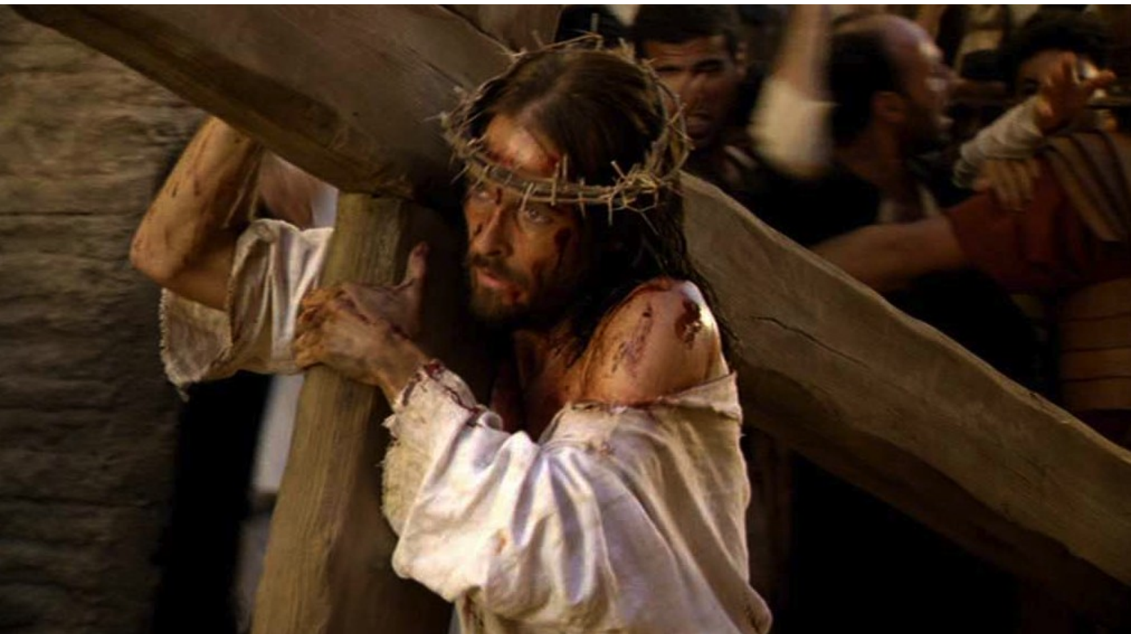
Maria di Nazaret : l'obliger à porter sa croix