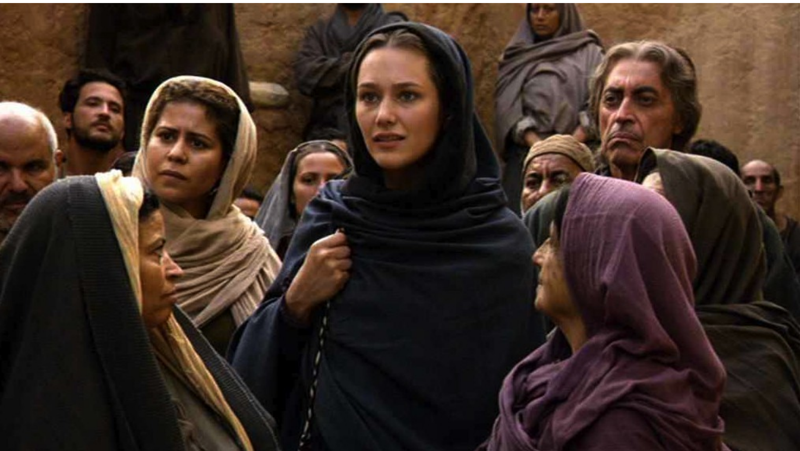
Maria di Nazaret : tandis que sa mère écoute avec passion ses enseignements.