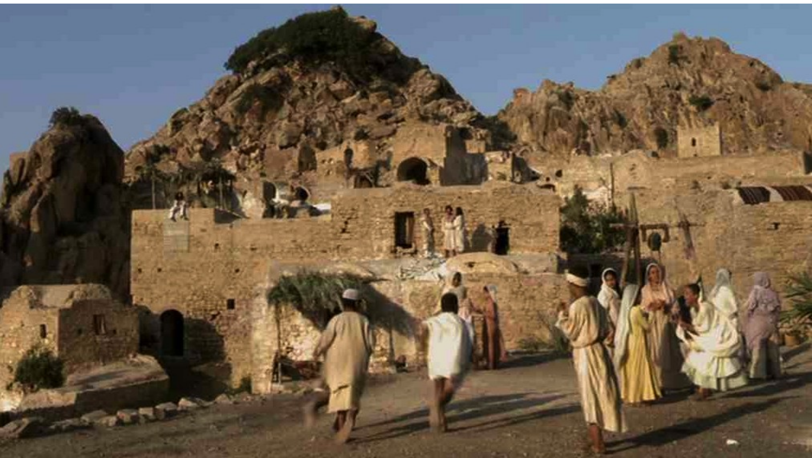
Maria di Nazaret : Sa jeunesse se passe à Nazareth