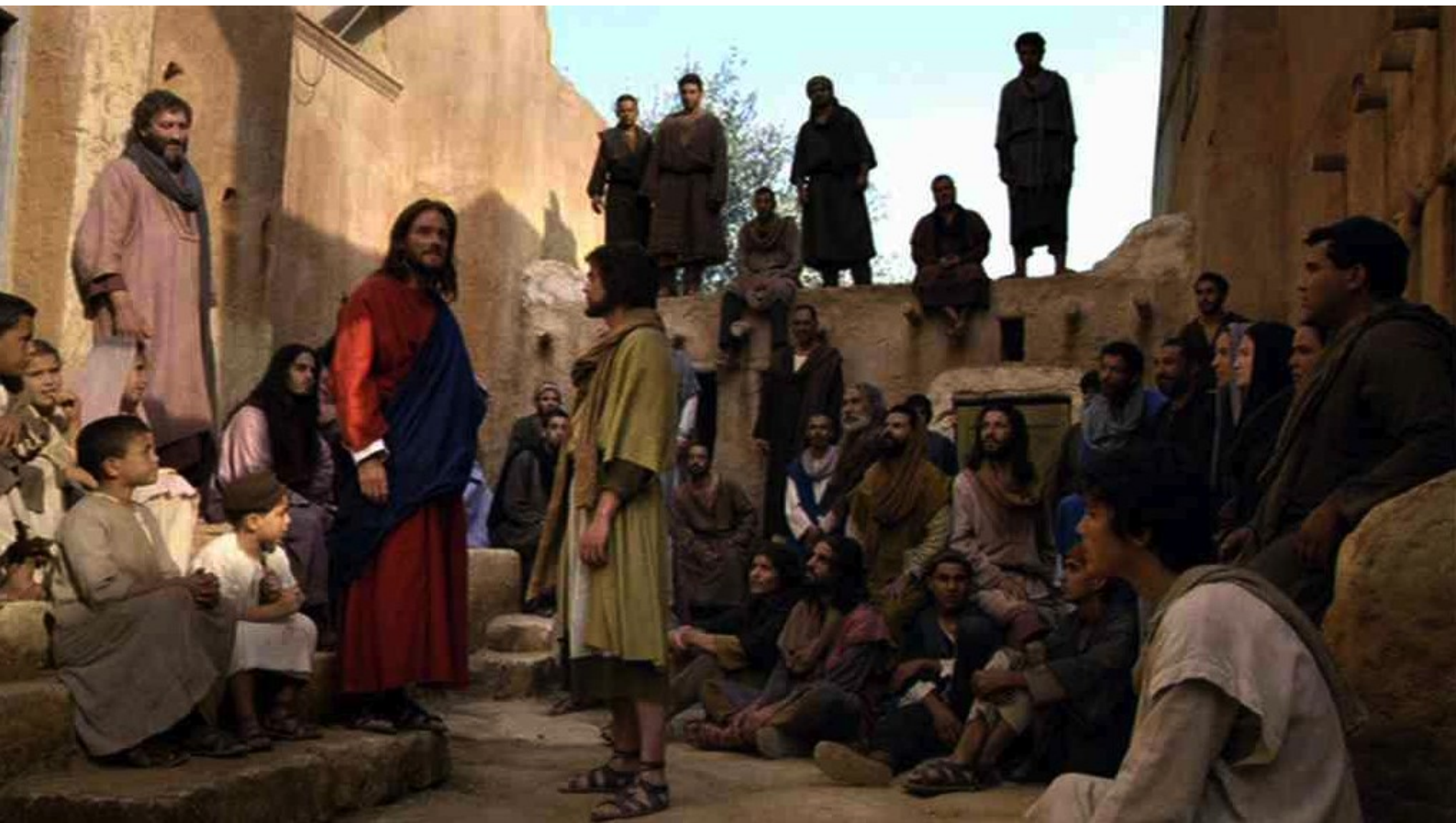
Maria di Nazaret : et fait des miracles dans les villes.