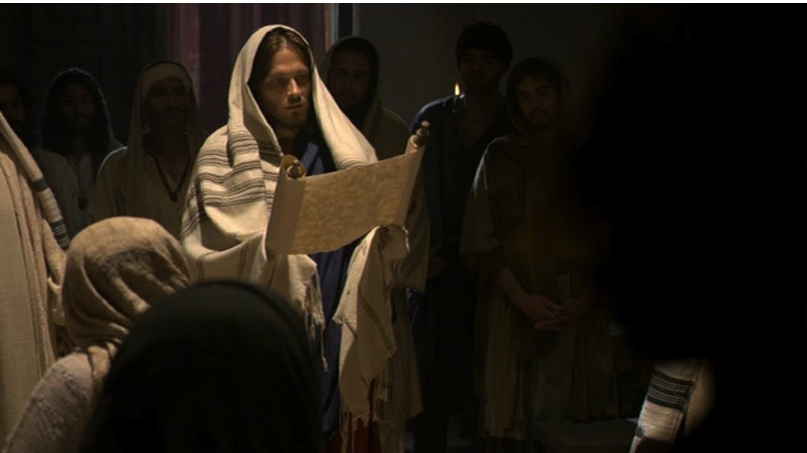
Maria di Nazaret : il explique les textes bibliques,