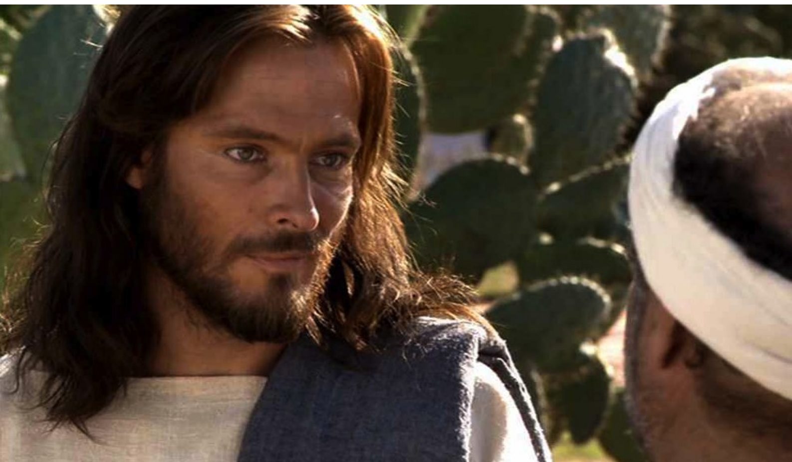
Maria di Nazaret : Jésus son fils