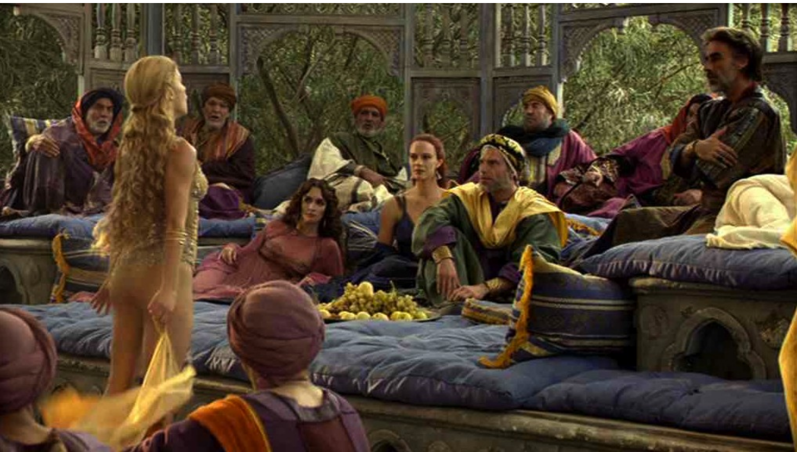
Maria di Nazaret : pour demander à Hérode Antipas la tête de Jean-Baptiste,