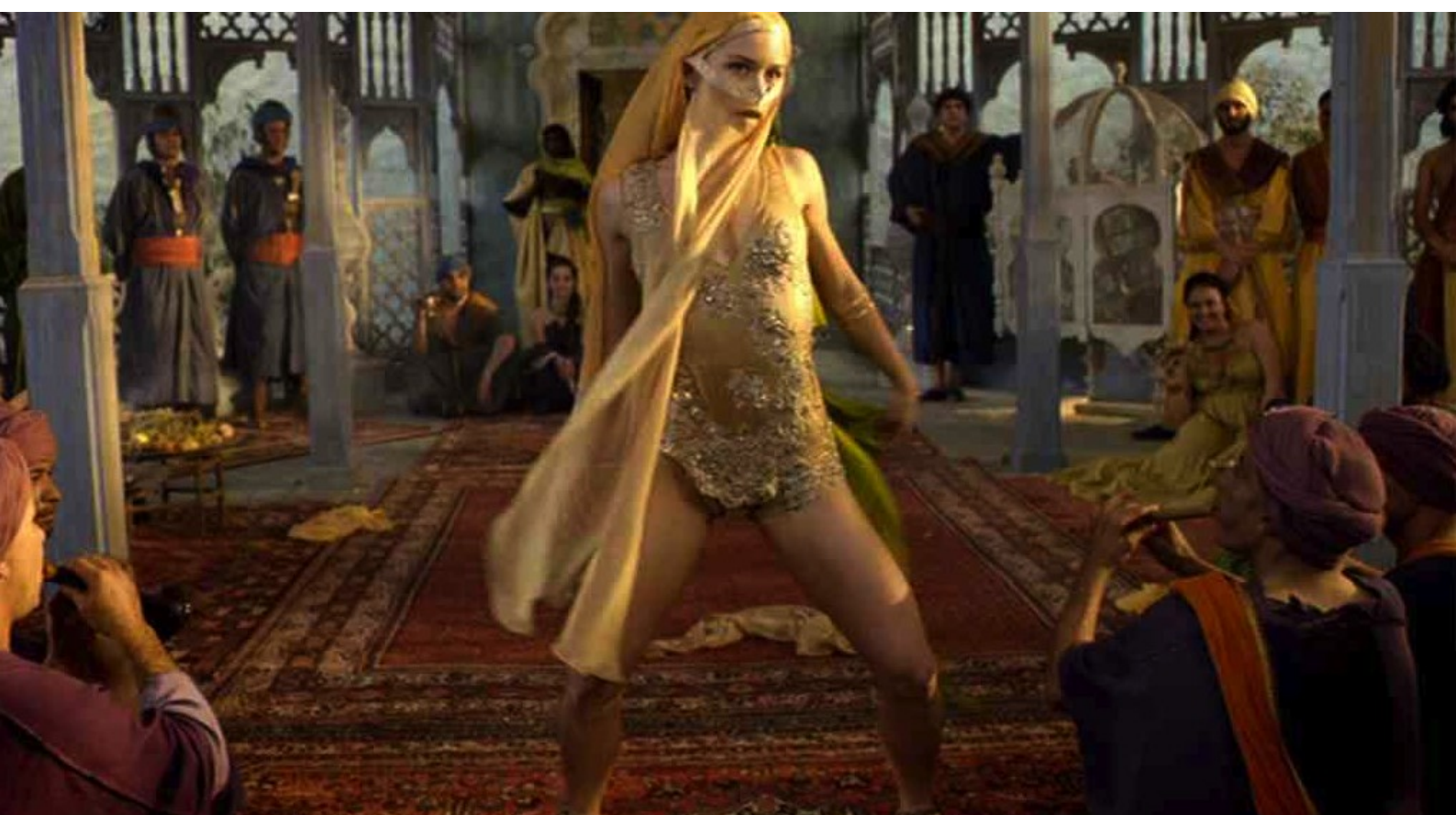
Maria di Nazaret : de manière provocante