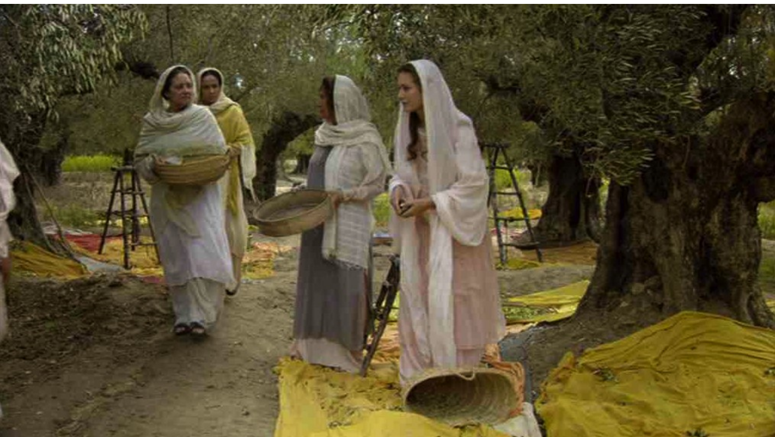
Maria di Nazaret : ou dans les oliveraies.