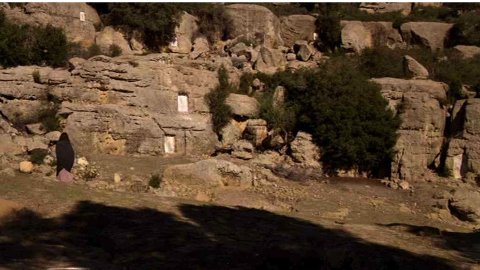
Maria di Nazaret : Pendant ce temps, Madeleine va au tombeau