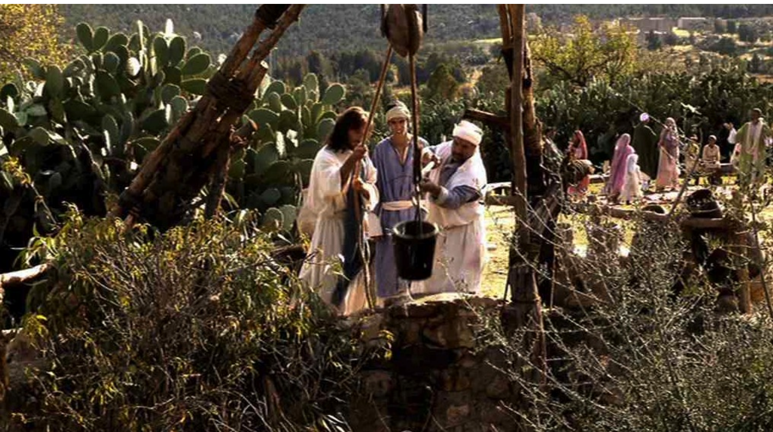
Maria di Nazaret : il prêche près des puits