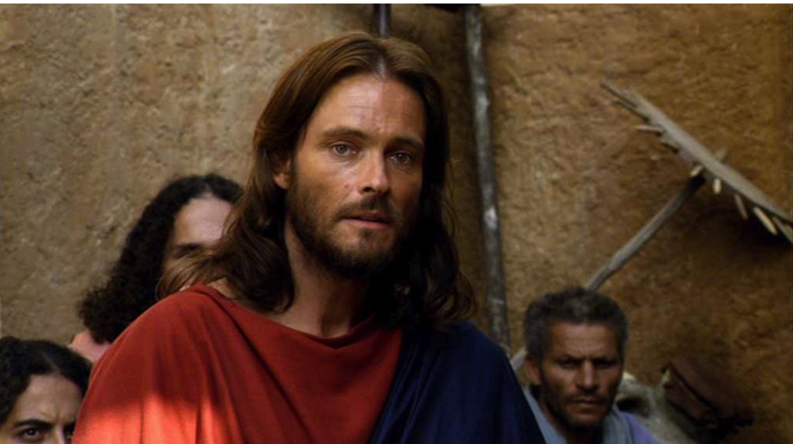
Maria di Nazaret : Jésus, devenu adulte, revient en Galilée