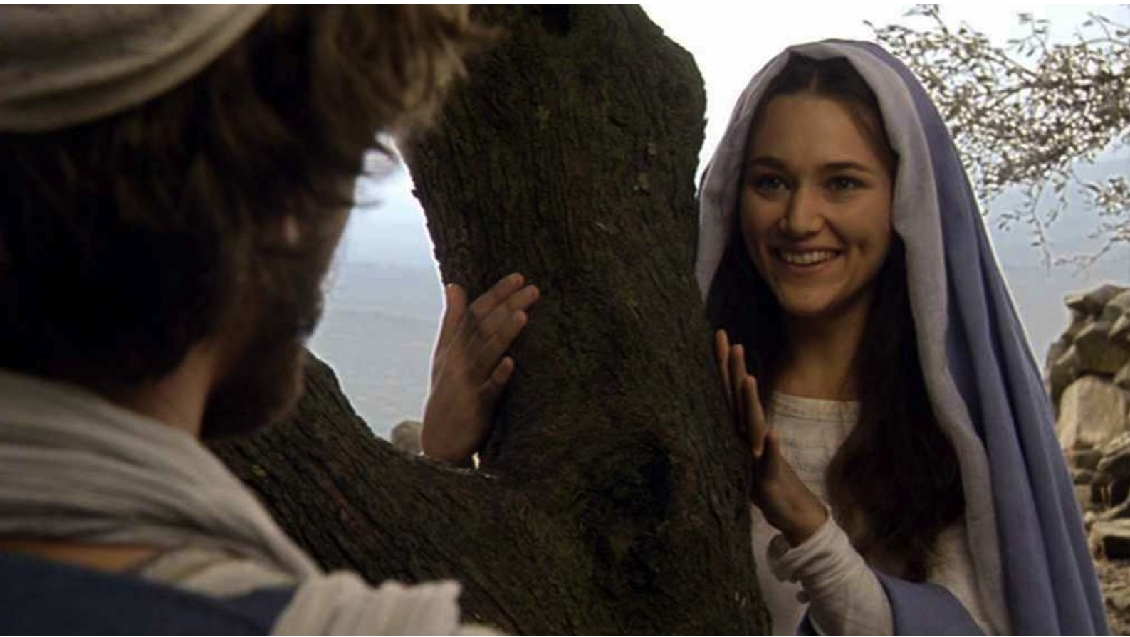
Maria di Nazaret : Marie