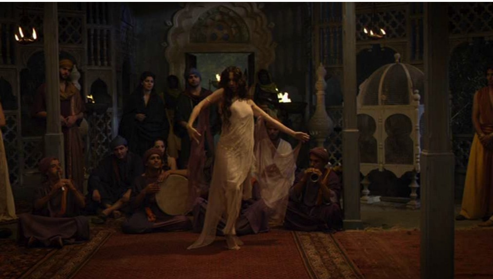
Maria di Nazaret : où elle danse