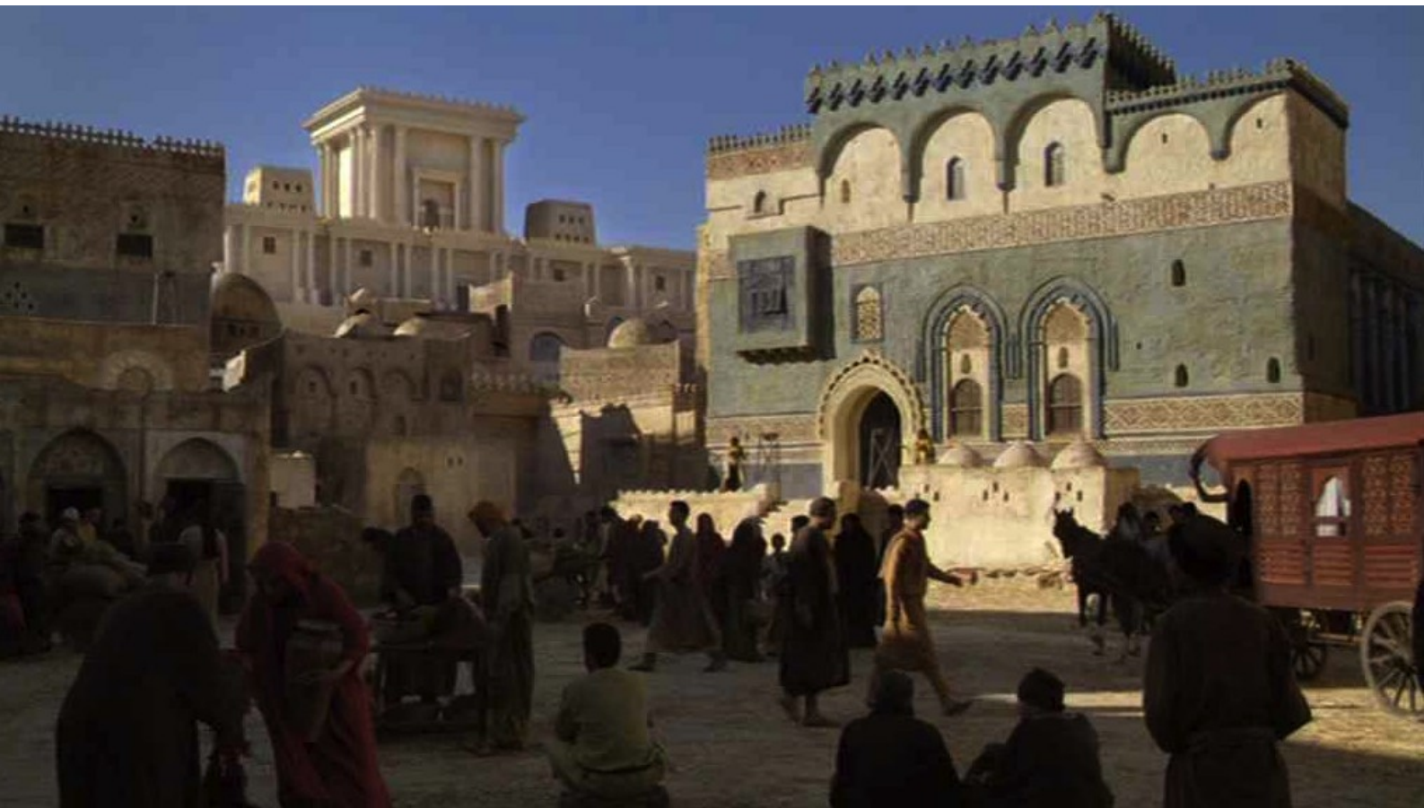
Maria di Nazaret : dans le palais royal de Jérusalem.