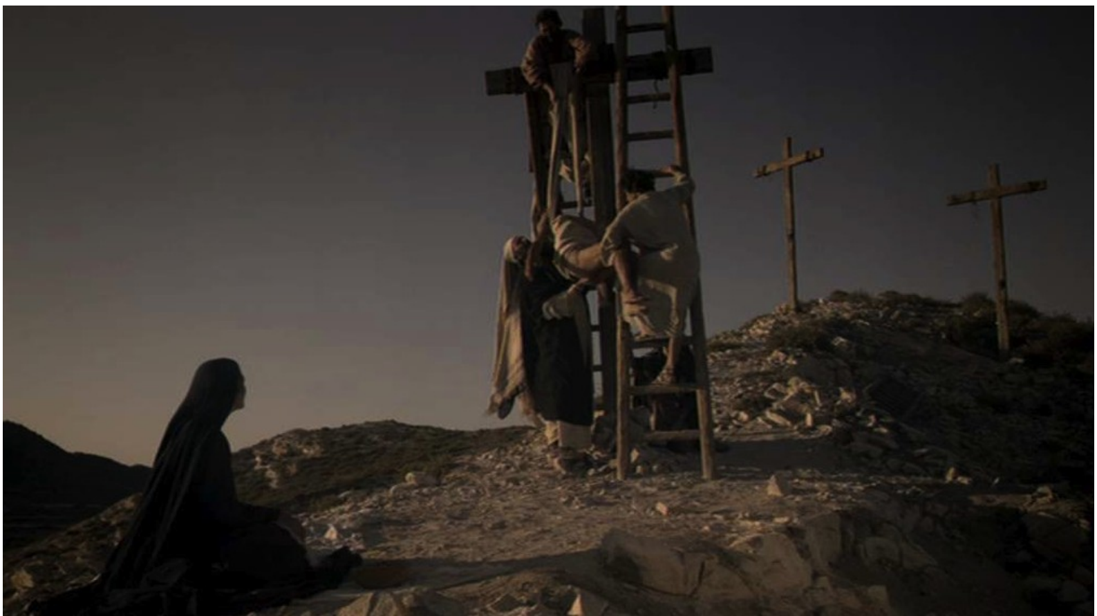
Maria di Nazaret : Puis on descend son cadavre