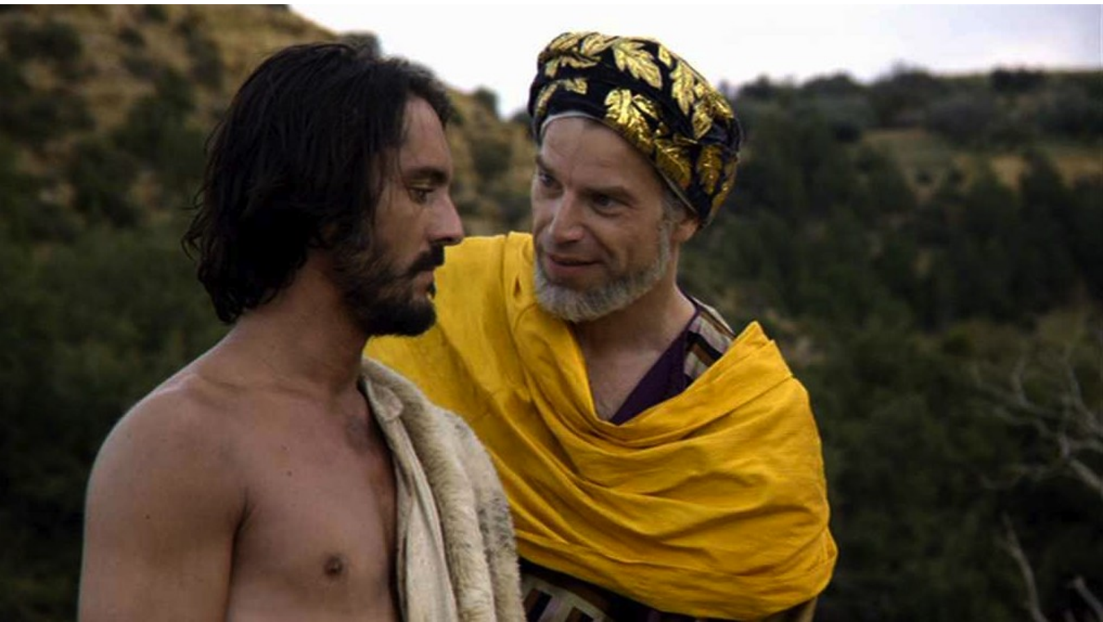
Maria di Nazaret : pour discuter avec lui