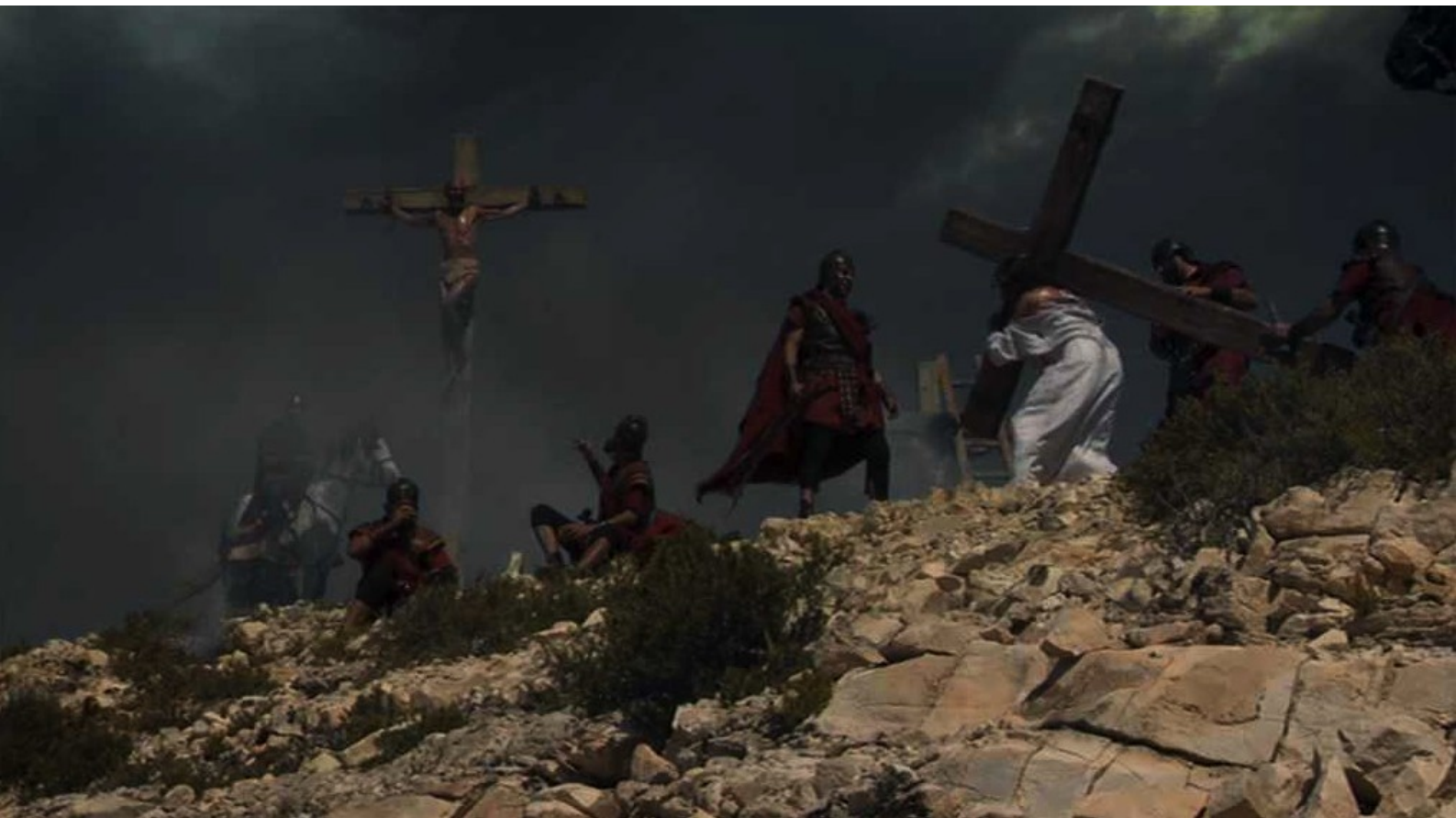
Maria di Nazaret : et à monter sur la colline du Calvaire.