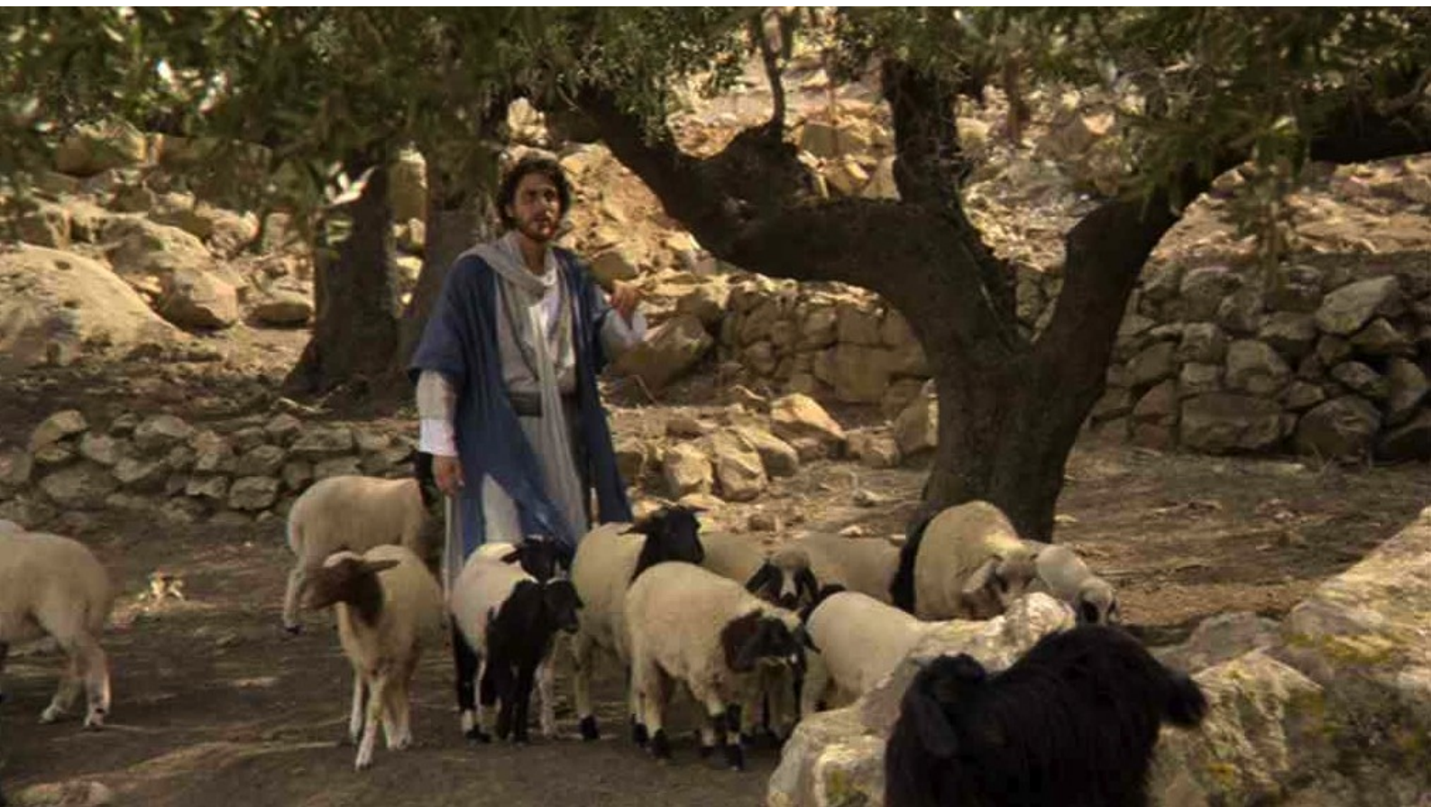
Maria di Nazaret : Pendant ce temps, Joseph vient trouver