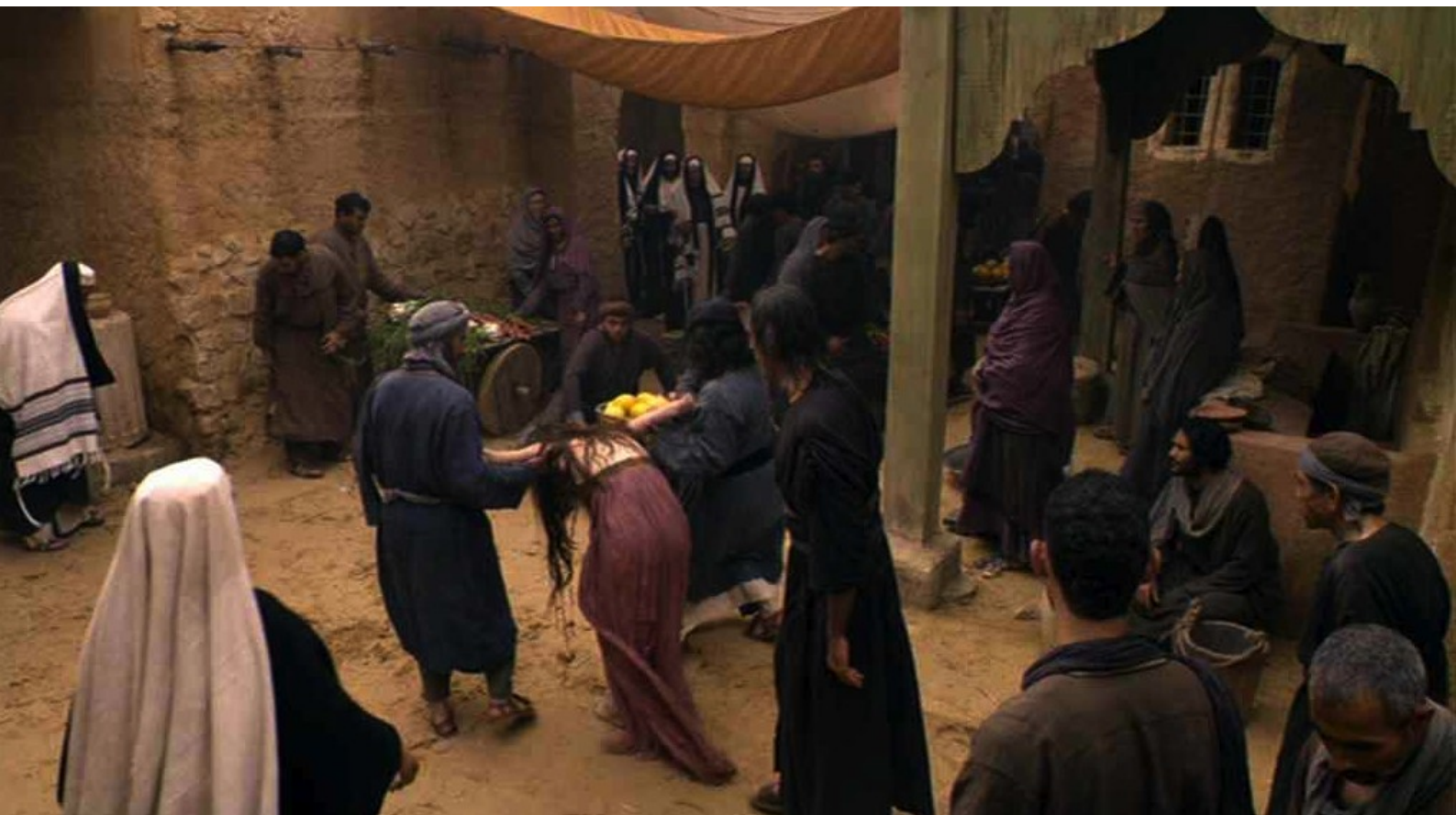
Maria di Nazaret : Accusée de débauche, elle est traînée dans la rue,