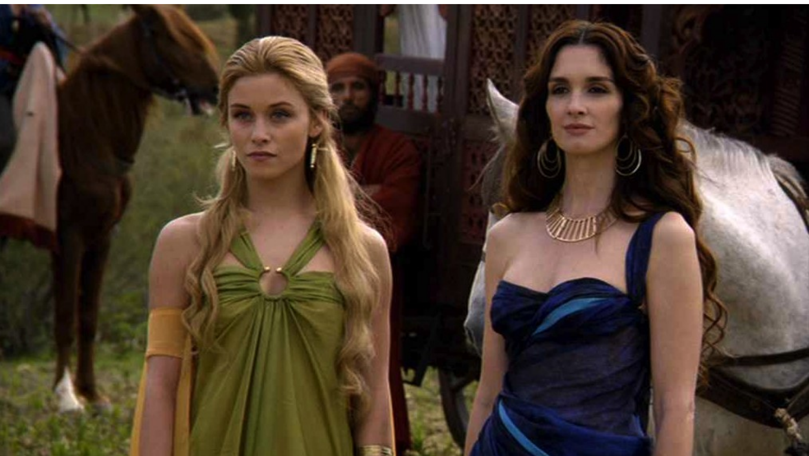
Maria di Nazaret : qui était une proche amie de Salomé