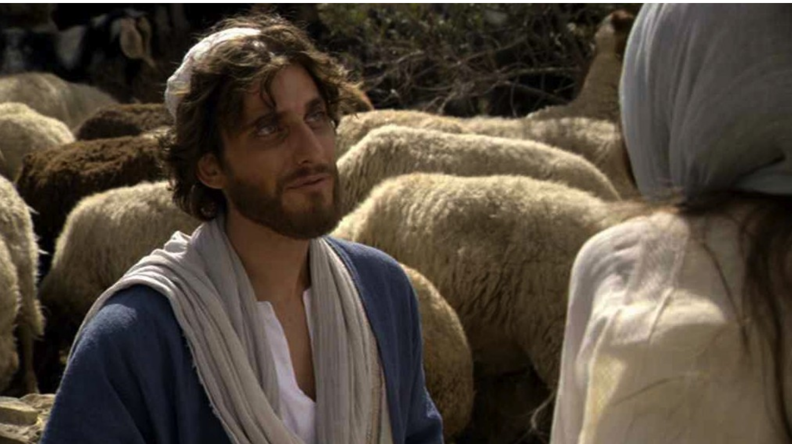
Maria di Nazaret : Joseph, son mari