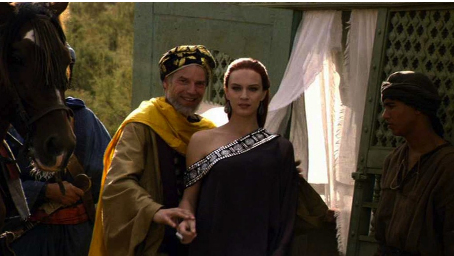
Maria di Nazaret : Mais la méchante Hérodiade conspire contre Jean