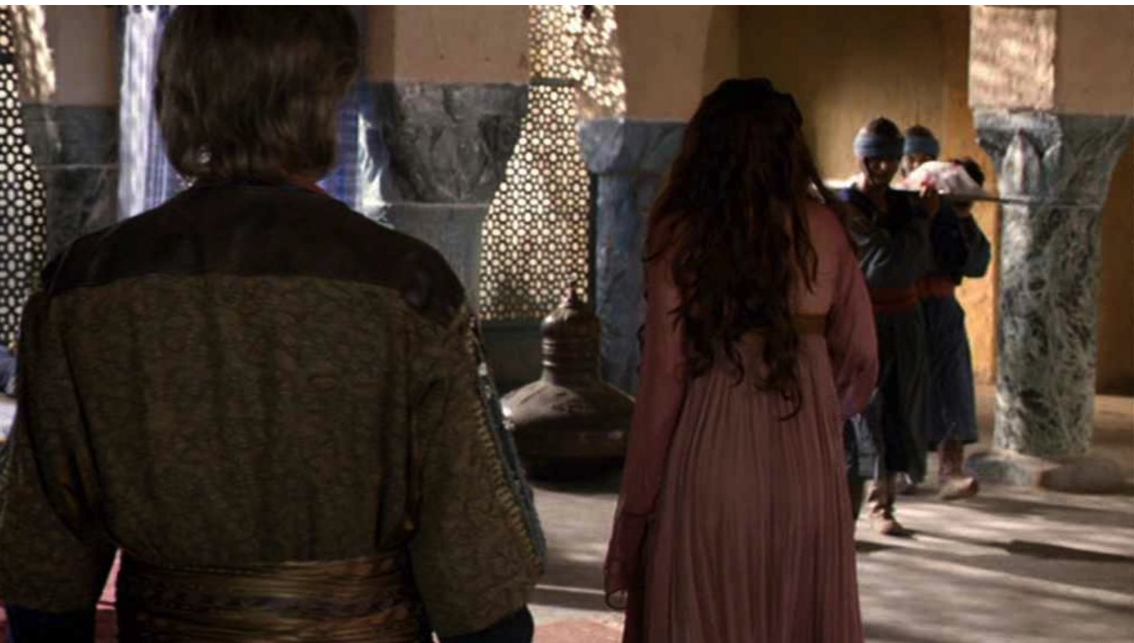
Maria di Nazaret : et des serviteurs apportent sa tête décapitée sur un brancard,