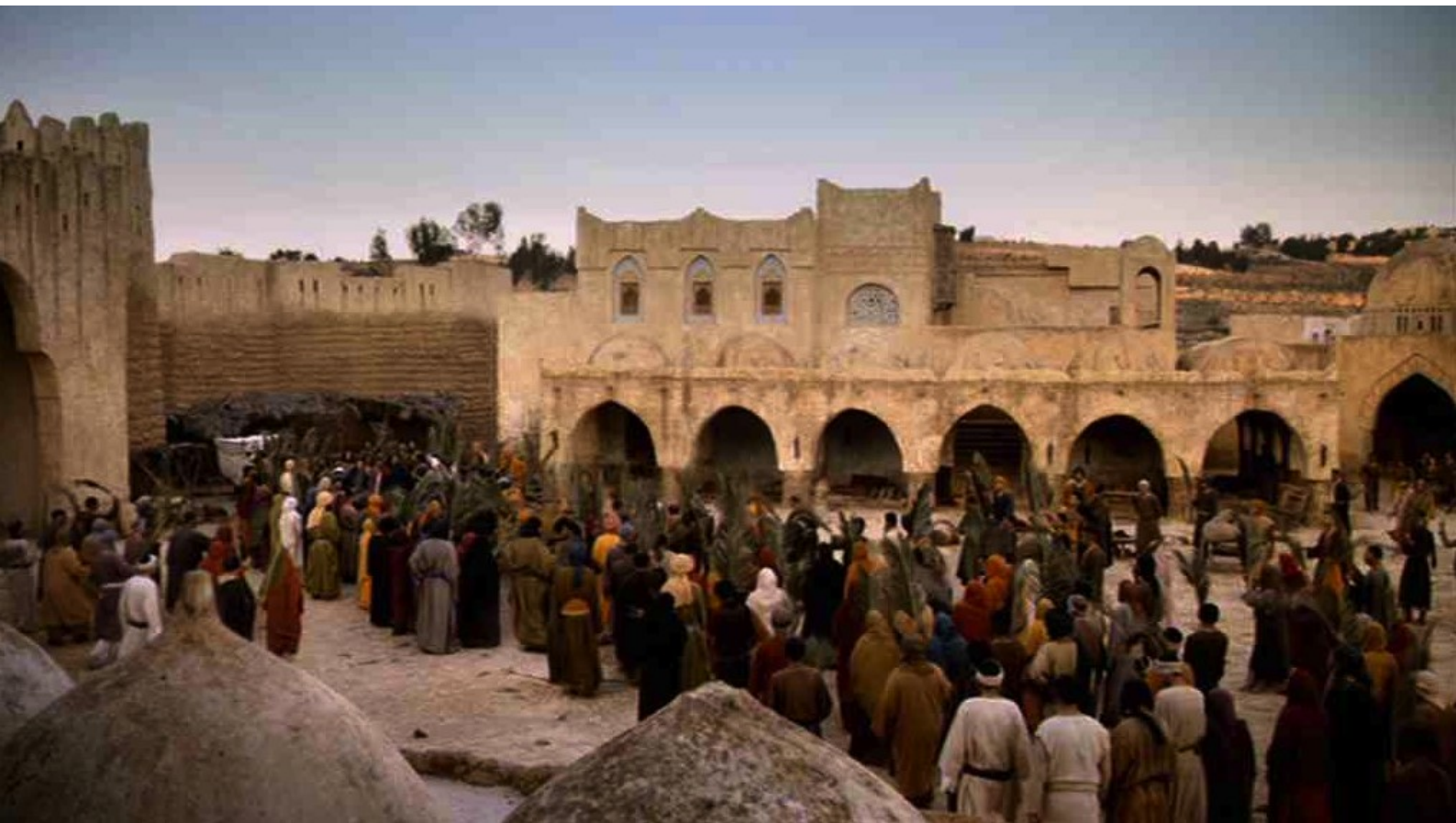
Maria di Nazaret : Puis Jésus entre à Jérusalem