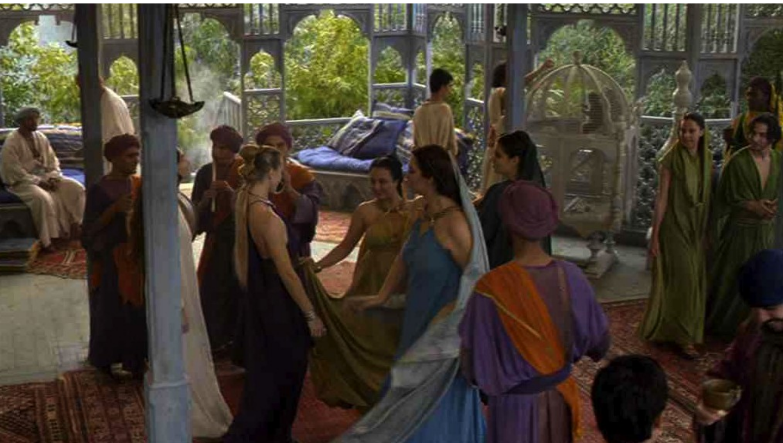
Maria di Nazaret : et vit dans la joie