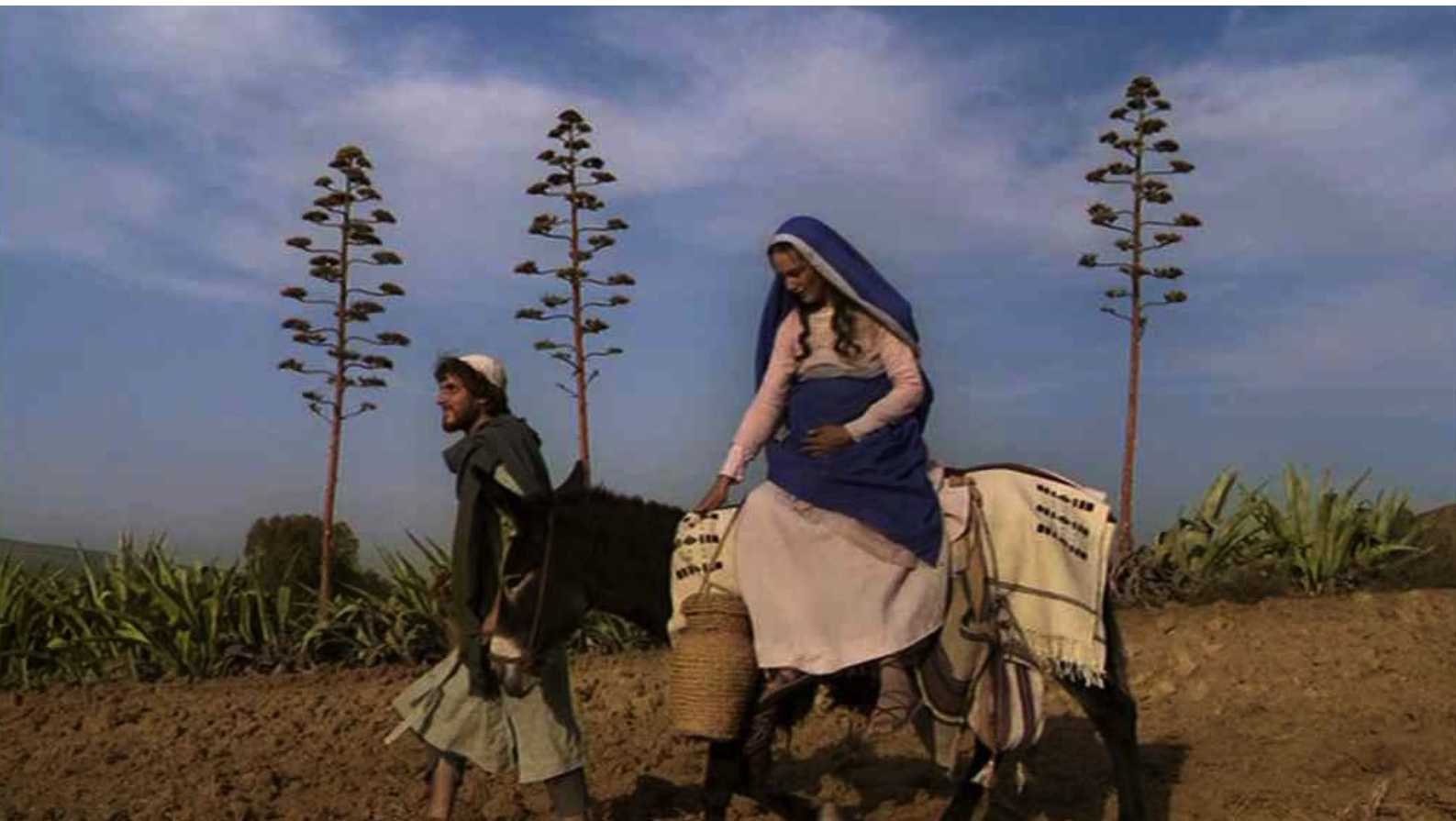
Maria di Nazaret : Puis c'est le voyage à Bethléem