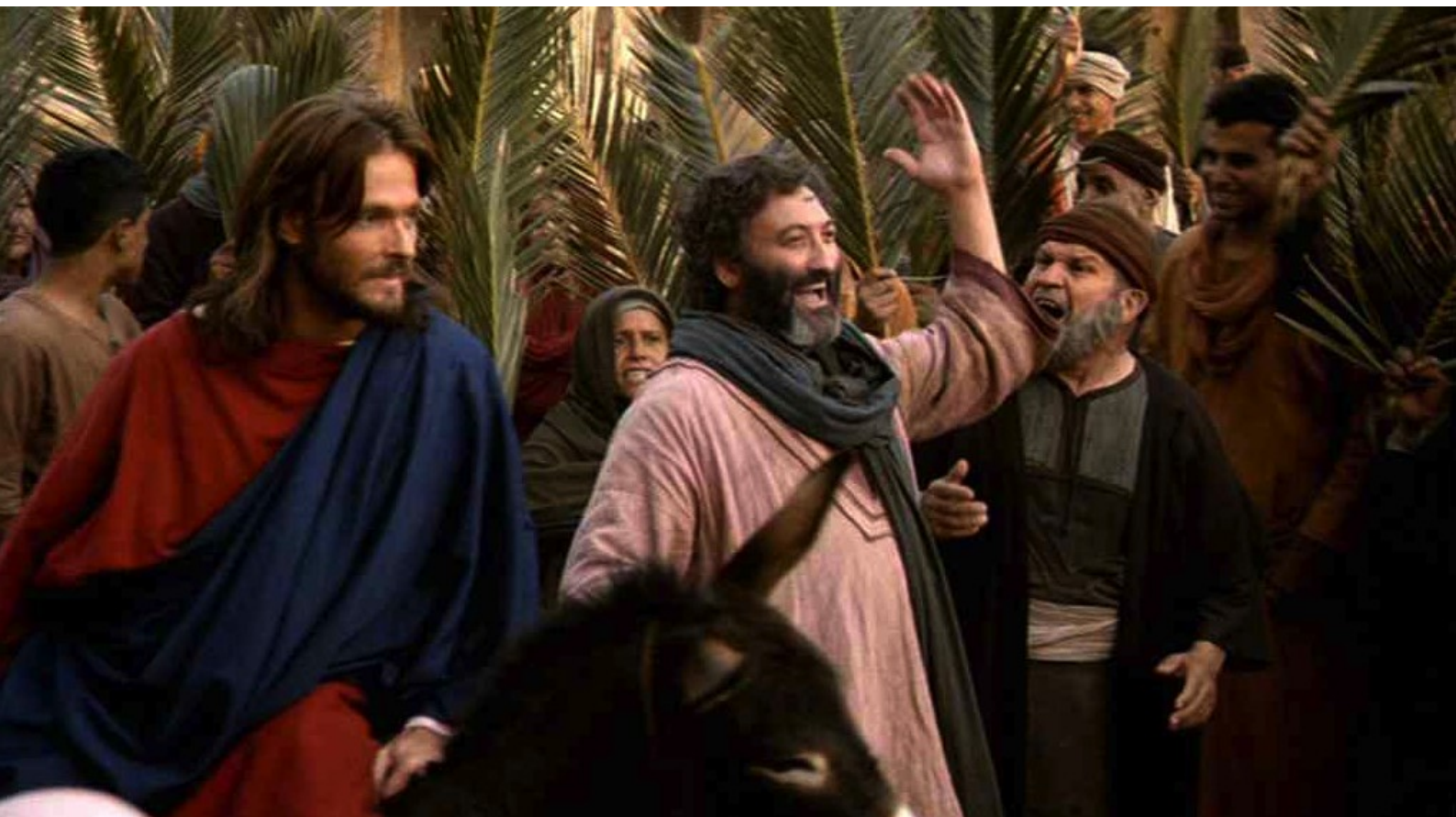
Maria di Nazaret : au milieu de la liesse générale.