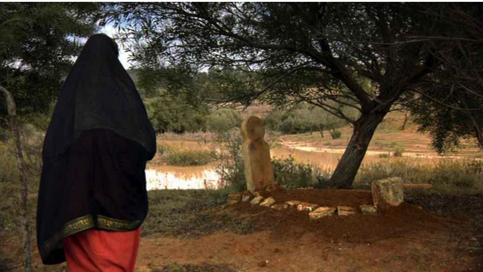
Maria di Nazaret : et, après son décès, Marie va se recueillir sur sa tombe.