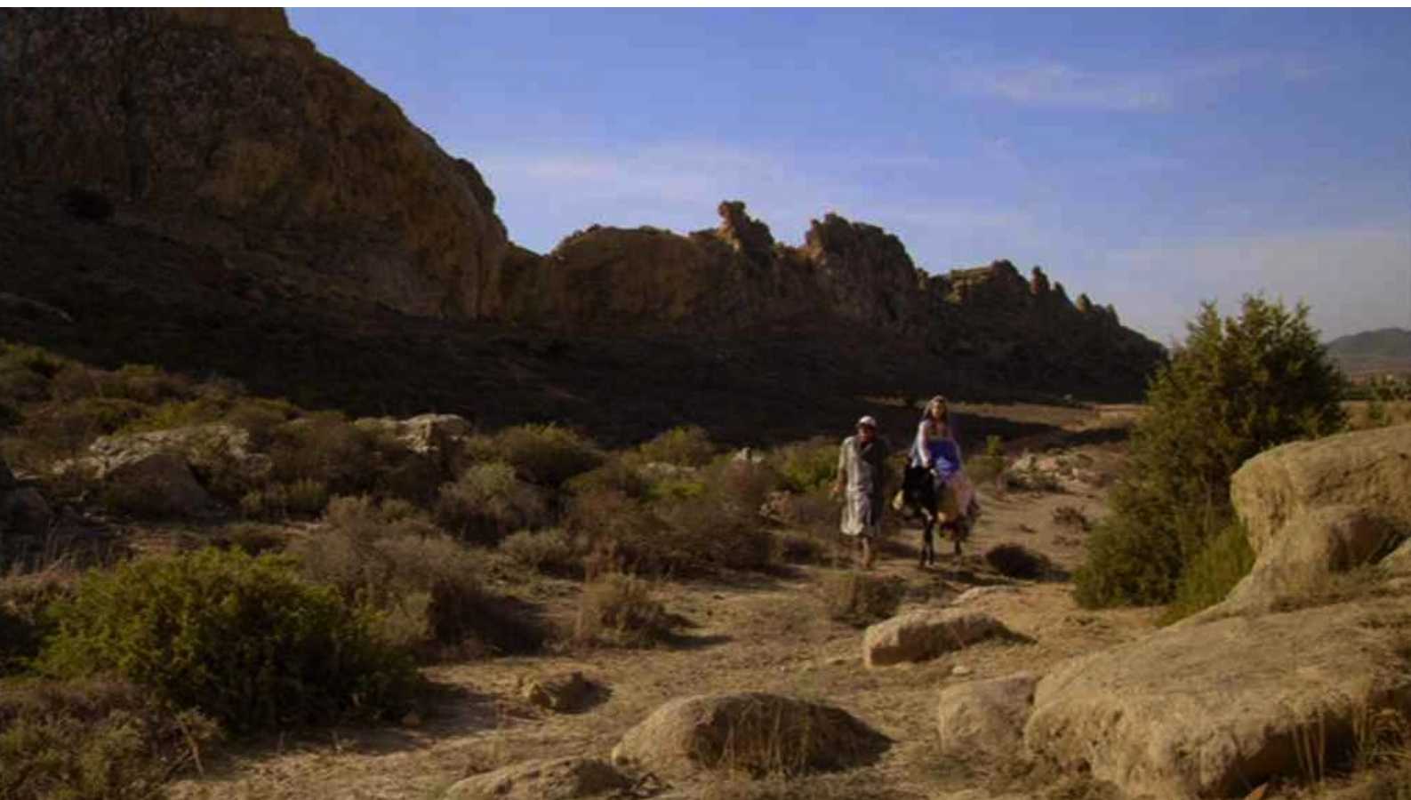
Maria di Nazaret : à travers le désert,