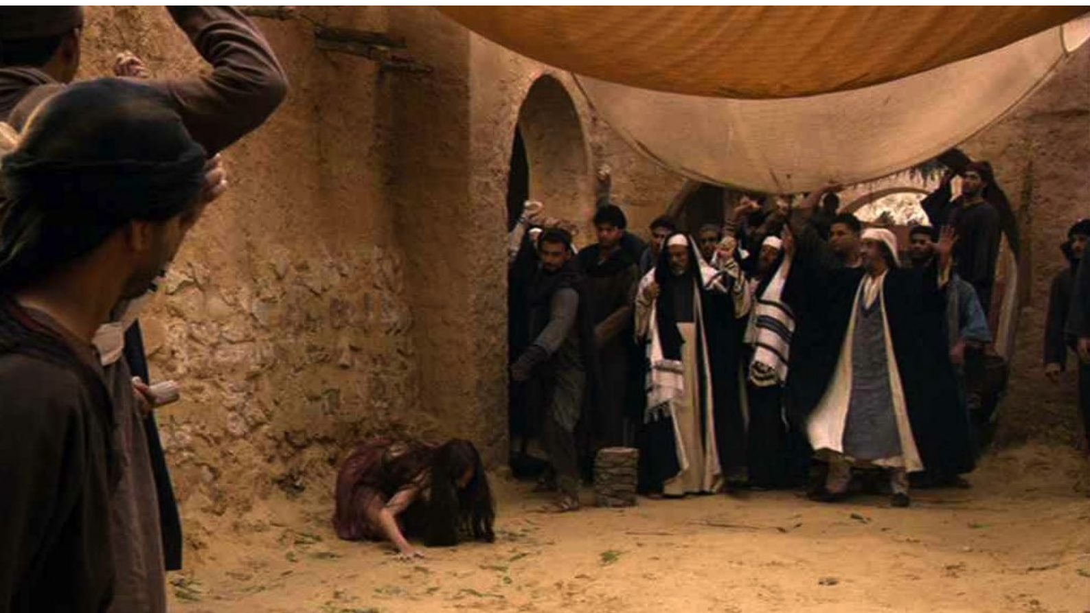
Maria di Nazaret : et va être lapidée