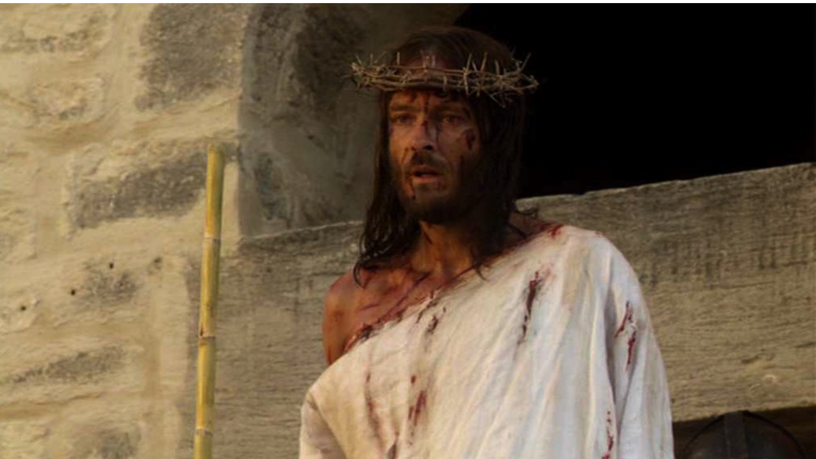
Maria di Nazaret : "Ecce homo".