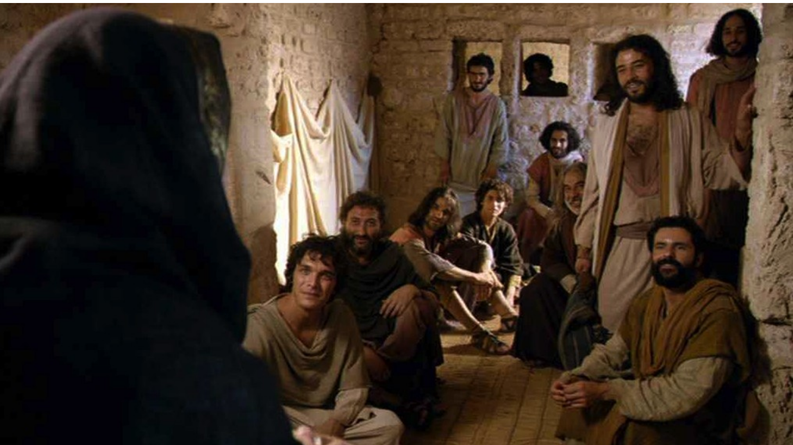
Maria di Nazaret : auprès des disciples qu'elle va consoler.