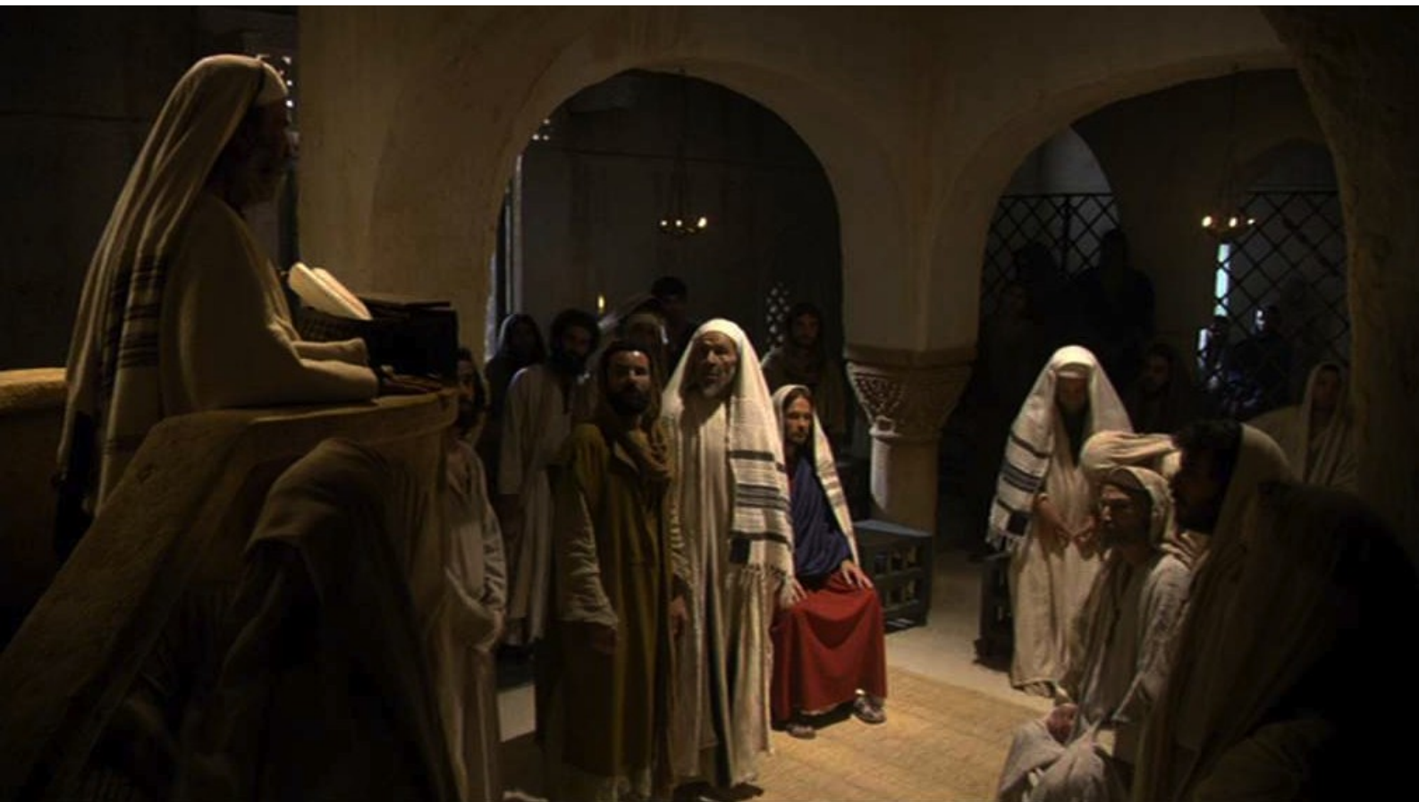
Maria di Nazaret : et, quand on le convie à s'exprimer,