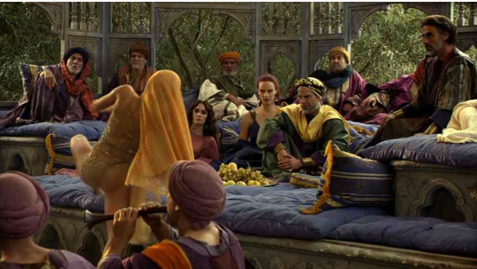
Maria di Nazaret : et pousse Salomé à danser devant le roi