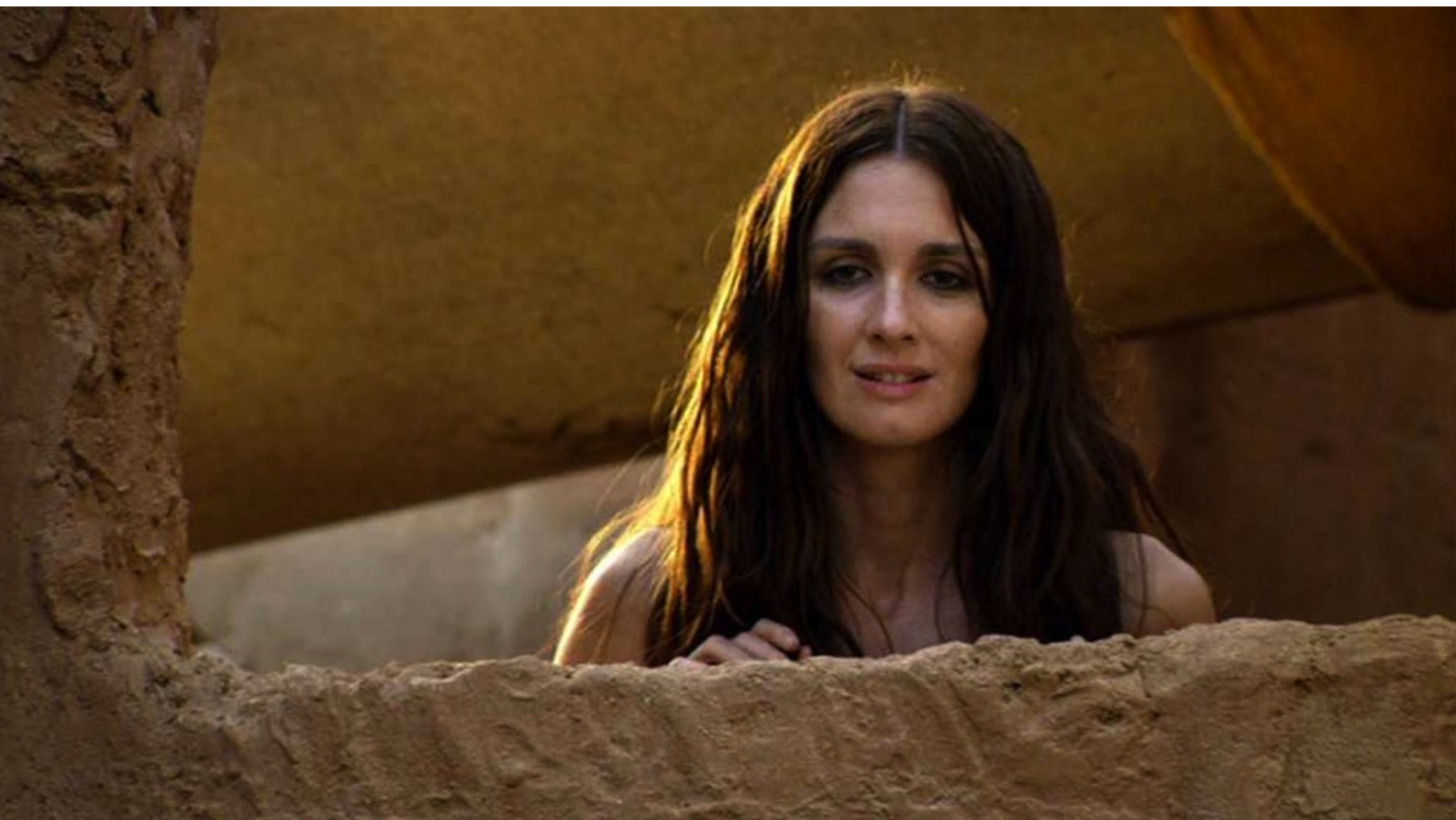
Maria di Nazaret : Dès lors Madeleine le suit et écoute ses paroles discrètement,