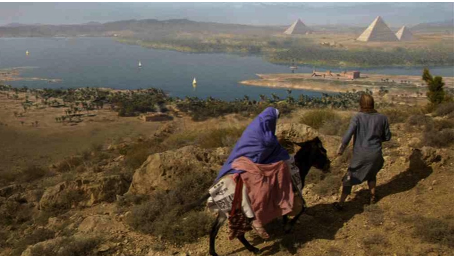
Maria di Nazaret : Suit la fuite en Égypte